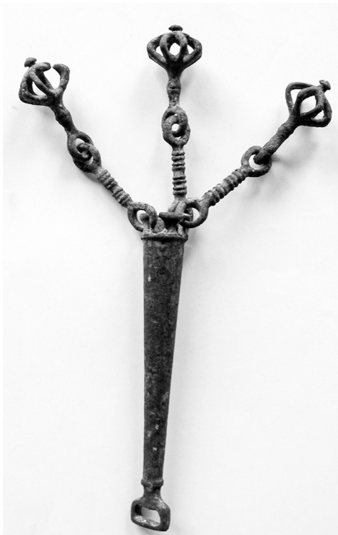
Fig. 3. Pendente da bardatura. Bruxelles, Musées Royaux d'Art et d'Histoire, Musée du Cinquantenaire, n. inv. R 1069.