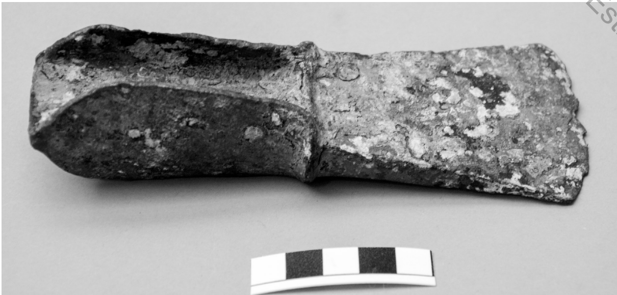
Fig. 2. Ascia ad alette con setto di divisione variante del tipo San Francesco. Peabody Museum, n. inv. 68-13-40-3424, foto 16780247