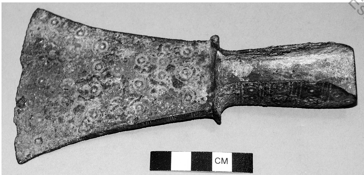
Fig. 1. Ascia ad alette con setto di divisione variante del tipo San Francesco. Peabody Museum, n. inv. 68-13-40-3424, foto 25060061