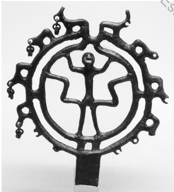
Fig. 4. Ansa di tazza bronzea. Berlin, Museum für Vor- und Frühgeschichte, n. inv. IVh 350.

L'ansa bronzea di una ben nota serie di tazze in Valmarecchia è conservata a Berlino (Fig. 4) 18 .