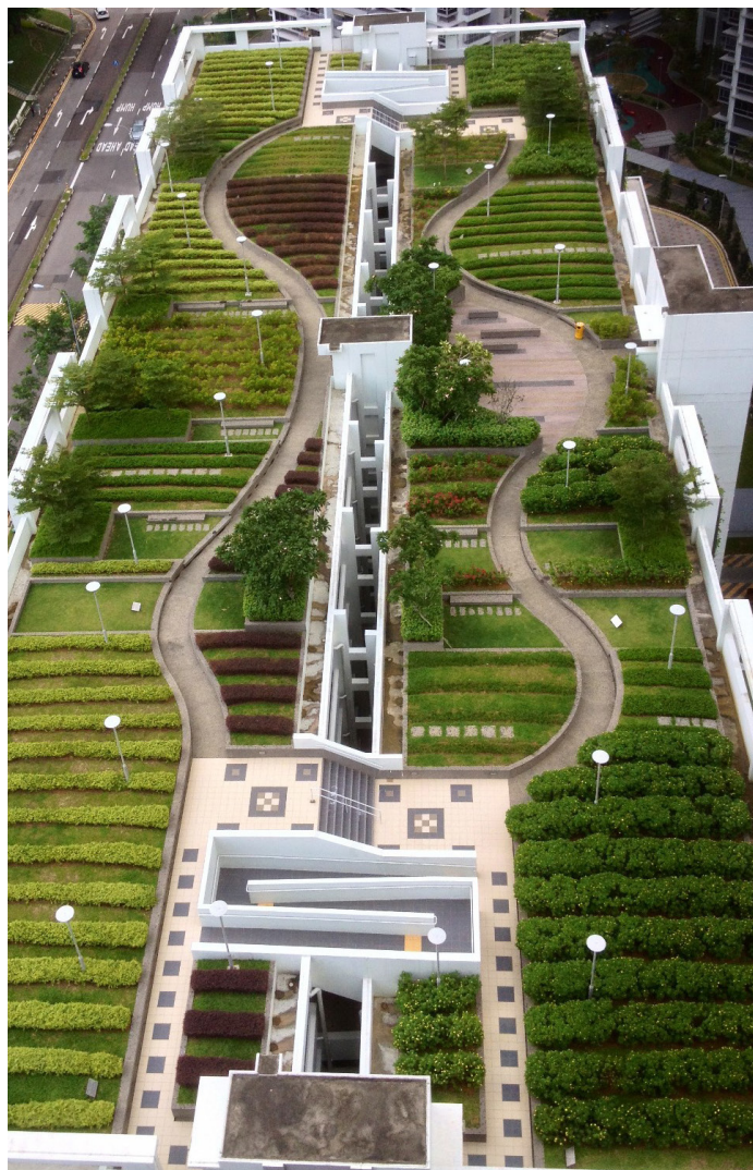
Figura 88. Vista aérea de la cubierta ajardinada de un aparcamiento en Toa Payoh Lorong 1, Singapur, 2013.

Pertencen al primero las soluciones enfocadas a: incrementar la cantidad de agua pluvial objeto de infiltración profunda (ELLIS, 2000; HOLMAN-DODDS et al, 2003; ELLIS, 2013); mejorar los efectos de la evotranspiración (SMITH y LEVERMORE, 2008; GEORGI & DIMITRIOU, 2010; COUTTS et al, 2013; SGOBBO, 2016); alargar el tiempo de desagüe (ELLIOTT y TROWSDALE, 2007; GALELLI, 2014). Las acciones del segundo grupo, a excepción de la amplificación del túnel de las cañerías de drenaje, están enfocadas a distribuir en el tiempo el volumen hídrico a absorber (TRAVIS y MAYS, 2008; DI BALDASARRE et al., 2014) así como a integrar en la red sistemas dispersivos o de inmisión en los cuerpos hídricos superficiales compatibles con las exigencias de absorción de los impactos medioambientales (De Vleeschauwer, 2014). La literatura científica sobre el tema en los últimos años parece orientarse decididamente hacia la preferencia por las acciones de contención de las necesidades antes que aquéllas que implican a la red de drenaje. A las tradicionales balsas de contención, progresivamente transformadas en water square y parques inundables, se han añadido numerosísimas propuestas a escala profundamente variable: desde las cubiertas verdes (Figura 88) a la reedición en clave urbana de las acequias de carretera excavadas ( side swales ) tradicionalmente adyacentes a las vías extraurbanas, desde los aparcamientos absorbentes a los sistemas de pozos y barbacanas de dispersión.