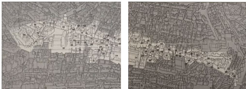
3: Il percorso della terza giornata della guida Notitie del bello, dell'antico e del curioso della città di Napoli di Carlo Celano (1692) evidenziato sulla veduta Fidelissimae Urbis Neapolitanae cum Omnibus Viis Accurata et Nova Delineatio di Alessandro Baratta (1629) [in Alessandro Baratta (...)1986].

Urbis Neapolitanae cum Omnibus Viis Accurata et Nova Delineatio di Alessandro Baratta (1629) 4 , Mappa topografica della città di Napoli e de' suoi contorni di Giovanni Carafa duca di Noja (1750-1775) 5 , le tavole dei quartieri di Napoli di Luigi Marchese (1804) 6 , la Pianta di Napoli di Federico Schiavoni (1872-1880) [Schiavoni 1992], le tavole del Catasto storico d'impianto (1895-1905) [Alisio, Buccaro 1999]. Queste cartografie furono eseguite in periodi diversi con tipologie differenti di rappresentazione. Con il Settecento le città si dotano di strumenti scientifici per rilevare i territori: le piante sostituiscono le vedute. La Mappa topografica del duca di Noja sta a Napoli come la Nuova Topografia di Roma di Giovanni Battista Nolli [Lelo, Travaglini 2016] sta a Roma 7 , per paragonare le più note piante settecentesche.