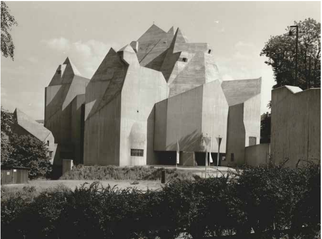
Fig. 5 Il Duomo di Neviges visto dal villaggio, 1968.

La stessa matrice simbolica viene perfettamente assorbita dall'opera di Böhm, che, mantenendo sotto traccia una sequenza di circonferenze – plasmándole plasticamente – disegna, strato per strato, soglie affinché il pellegrino si senta protetto e autorizzato a valicare i limiti del sacro.