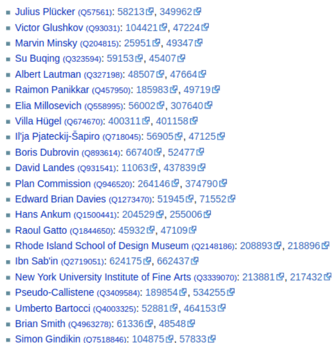
Fig. 7 Report aggiornato al 6 febbraio 2019 delle Single value violations per la proprietà SHARE Catalogue author ID ( https://tinyurl.com/y7zg6fv4 ).