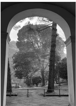
Fig. 3 Castellammare di Stabia (Na). Reggia di Quisisana. Ingresso al giardino (Veronese, 2021).

ito da Carlo II d'Angiò, in memoria della guarigione da una grave malattia curata nella dimora stabiese. Fu proprio il re angioino a volere la costruzione delle prime fabbriche nel 1284 sotto la direzione dell'architetto locale Giovanni Vaccaro 2 . Ampliata da Roberto d'Angiò, la reggia divenne dimora abituale dei re angioini e durazzeschi che la scelsero come sito reale a carattere venatorio per sfruttare il fitto bosco adiacente 3 .