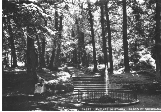
CASTELLMARE DI STABIA - PARCO DI QUISISANA