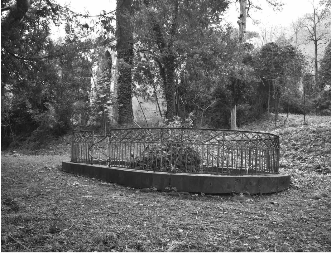
Fig. 6 Giardino del Quisisana. La fontana settecentesca e la torre Colombaia (Veronese, 2021).