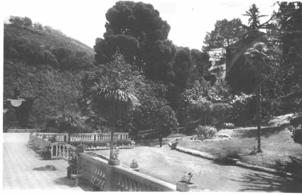
Castellammare di Stabia - Quisisana - Parco dell'Hotel Royal e Monte Capriola