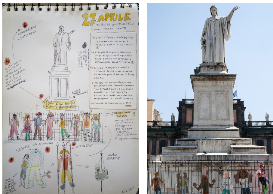
Figura 1 Immagini dell'iniziativa Che fine hanno fatto i bambini?: a) schema organizzativo dell'evento; b) sagome dei corpi dei bambini nel lockdown.

(Fonte: Scuola e bambini nell'emergenza Covid-19; illustrazioni di Ananda Ferrentino)