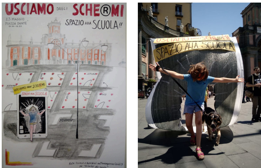
Figura 3 Schema organizzativo e foto dell'evento Usciamo dagli sche@mi

(Fonte: Scuola e bambini nell'emergenza Covid-19; illustrazioni di Ananda Ferrentino)