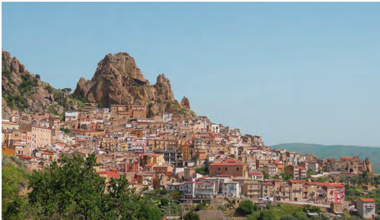
Fig. 5 – Comune di Gagliano Castelferrato (EN): il paesaggio storico urbano