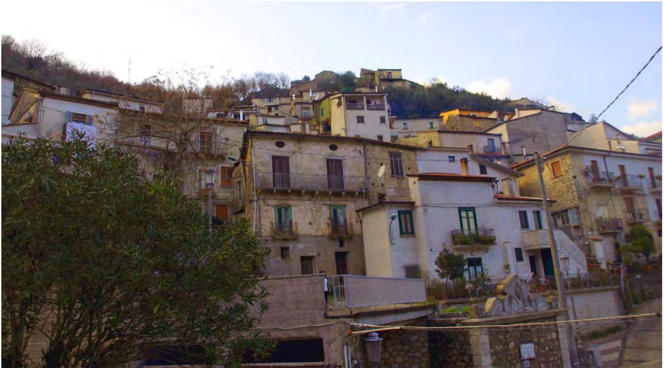
Fig. 1 – Comune di Sassano: il paesaggio storico urbano