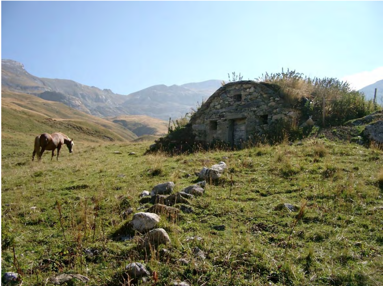
Fig. 4 – Alpeggio nell'area G.A.L. Mongioie, con locale per la conservazione dei latticini, detto “sella” o “truna”