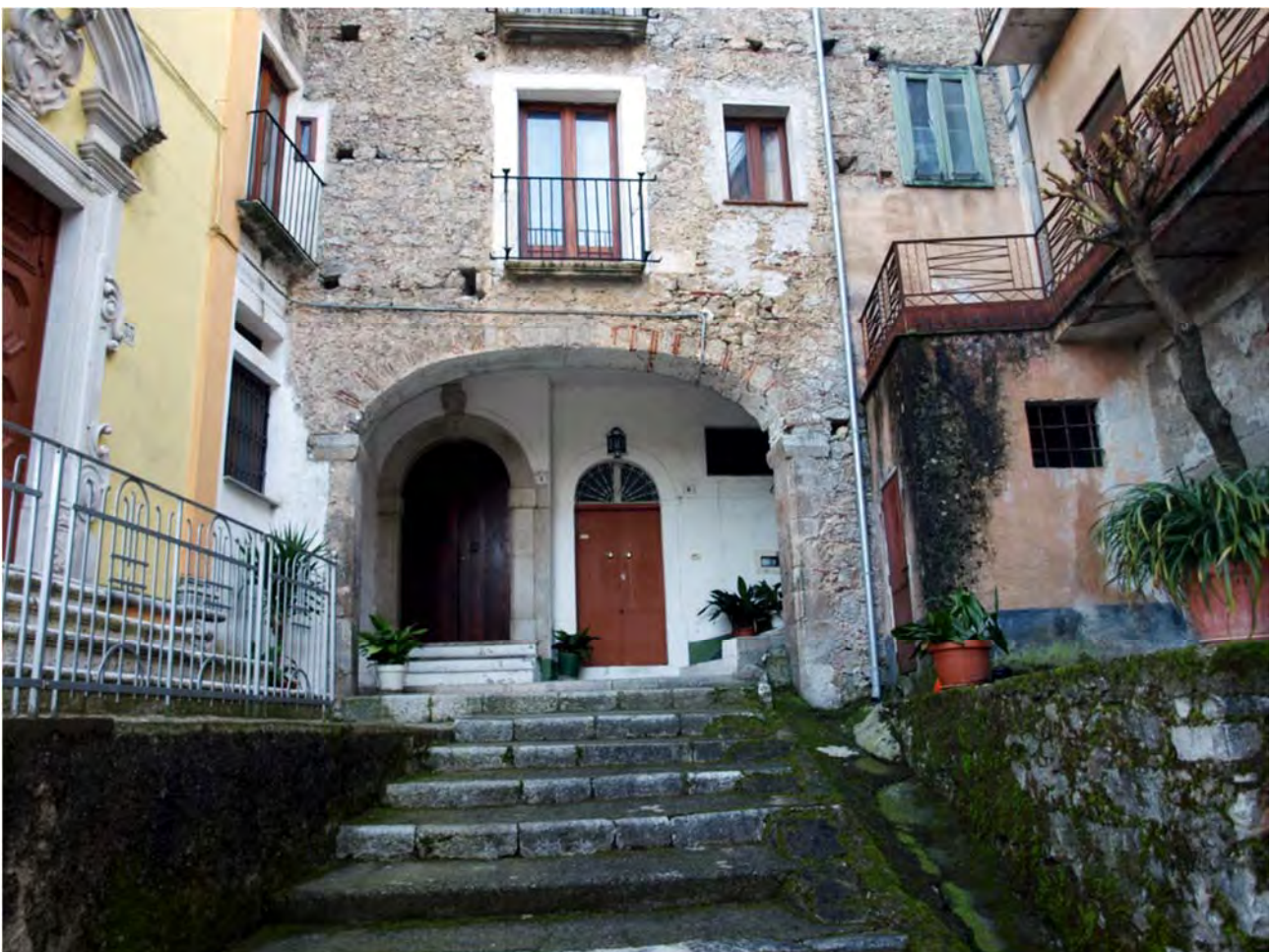
Fig. 2 – Comune di Sassano: esiti delle transizioni sull'ambiente costruito