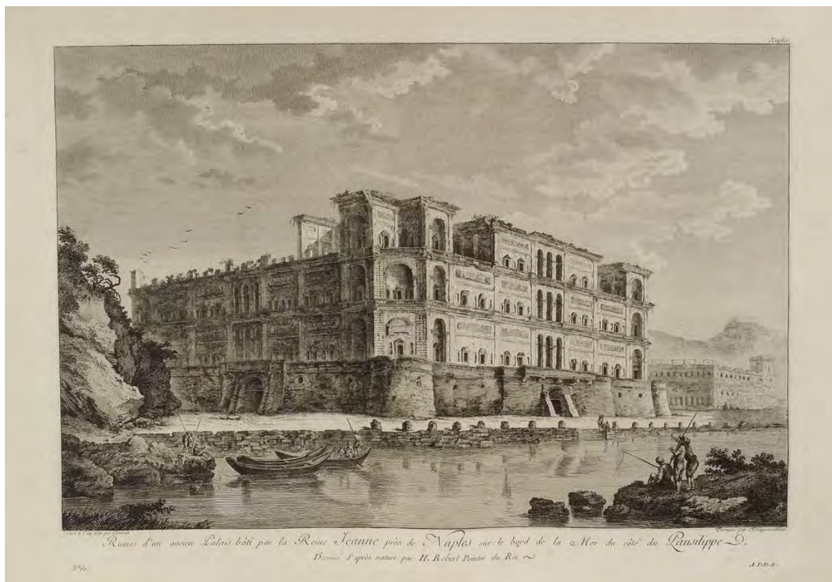
Hubert Robert (dis.), Louis Germain e François Dequauviller (inc.), Ruines d'un ancien Palais bâti par la Reine Jeanne près de Naples sur le bord de la Mer du côté du Pausilippe , 1781