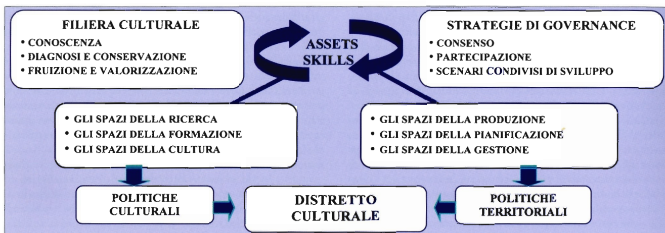
Fig. 1 - La sinergia tra le fasi della filiera culturale e le strategie di governance è in grado di coinvolgere i soggetti impegnati nei settori della cultura, della ricerca e della formazione, come pure in quelli della produzione, della pianificazione e della gestione. Le politiche culturali e le politiche territoriali che ne derivano - per le implicazioni economico-produttive sorte ai processi di conservazione, tutela e valorizzazione del patrimonio, per il consenso e la partecipazione dei soggetti locali su scenari condivisi di sviluppo - si rivelano essenziali nella formazione dei distretti culturali. Riprendendo in un'ottica innovativa il modello del distretto industriale, il distretto culturale basa la competitività territoriale sulle risorse culturali sedimentate nei luoghi per promuovere economie di scala e implementare l'indotto.

re parametri unitari affinché emergano caratteri di omogeneità spaziale e/o territoriale a cui applicare efficaci strategie di gestione e intervento. Ripartire il territorio in una molteplicità di tessere - sottoposte a spinte orizzontali più o meno intense in base alla frequenza/qualità delle relazioni e a spinte verticali connesse alla matrice naturale e all'apporto antropico - non va interpretata nell'ottica di un "automatismo geografico", ovvero di un'operazione fine a se stessa, espressione di uno specifico ambito disciplinare; al contrario - maturata in un periodo di transizione tra lo stadio industriale e post-industriale, indotta dalla sostanziale carenza dei modelli pregressi - è da ritenersi indispensabile perché possano trovare concreta attuazione dinamiche territoriali improntate all'innovazione, alla competitività, alla valorizzazione del paesaggio.