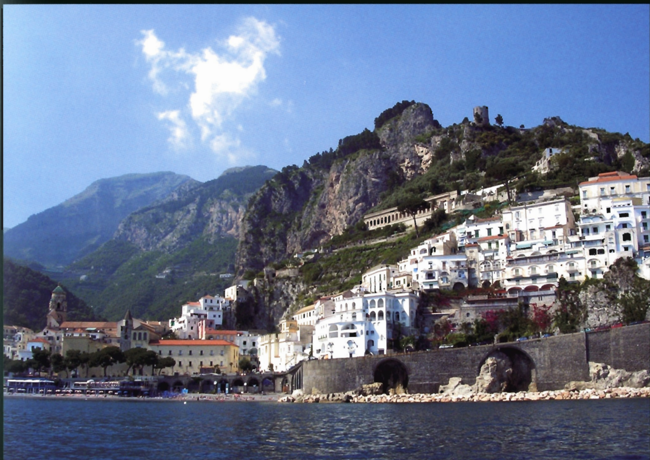
Amalfi e il paesaggio terrazzato

Il paesaggio si rivela una categoria interpretativa trasversale attraverso cui si svela l'unitarietà dei saperi e, nel contempo, diviene strumento di conoscenza per l'interpretazione delle realtà territoriali.