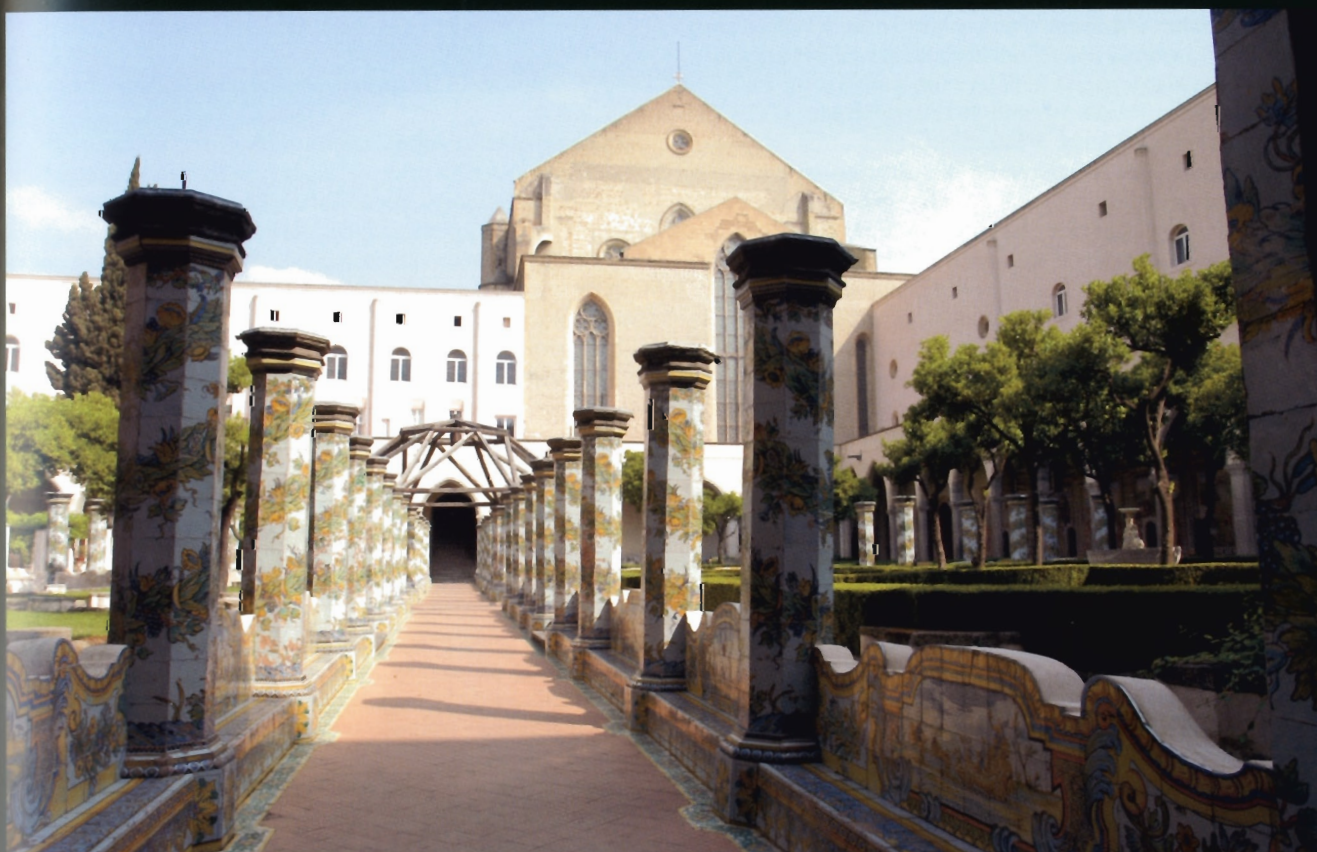
Napoli, chiostro di S. Chiara

Piattaforma per le politiche di rifunzionalizzazione, la tutela si pone quale espressione matura della ricerca di base, finalizzata a cogliere l'armatura identitaria e le matrici storico-culturali dell'insieme di segni impressi sul territorio. Ad ogni stadio storico, ad ogni fase della stratigrafia paesistica corrispondono forme connesse a funzioni diverse che coesistono e spesso si sovrappongono. Analizzato in tale prospettiva, il paesaggio si propone quale archivio di beni culturali da intendere nella duplice accezione di espressione dell'identità collettiva e risorsa per lo sviluppo endogeno del territorio.