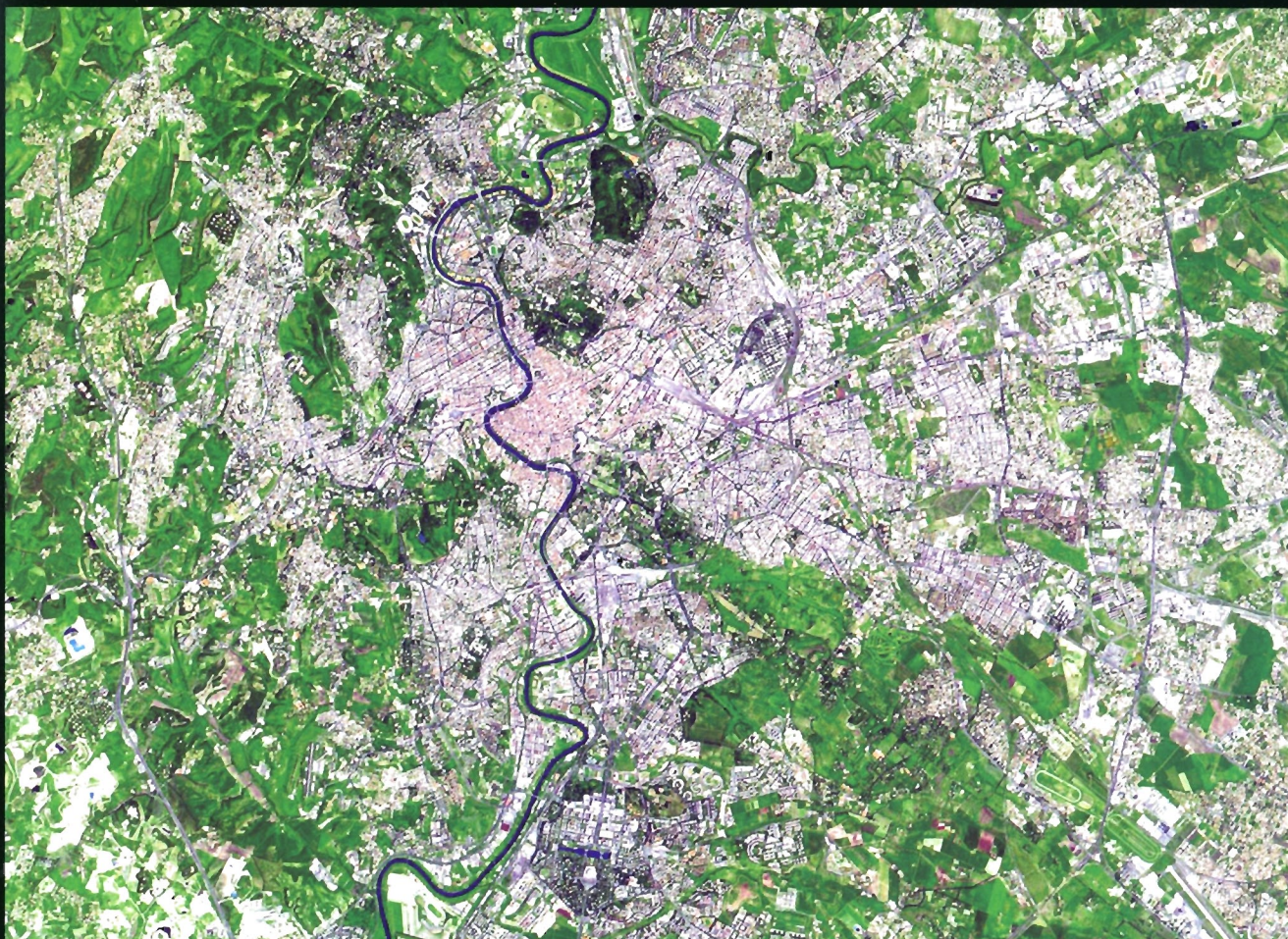
Roma, immagine satellitare

L'articolazione in distretti culturali, la diversificazione dei sistemi economico-produttivi su basi endogene orientano le politiche territoriali verso il coinvolgimento e la partecipazione di stakeholders e attori locali.