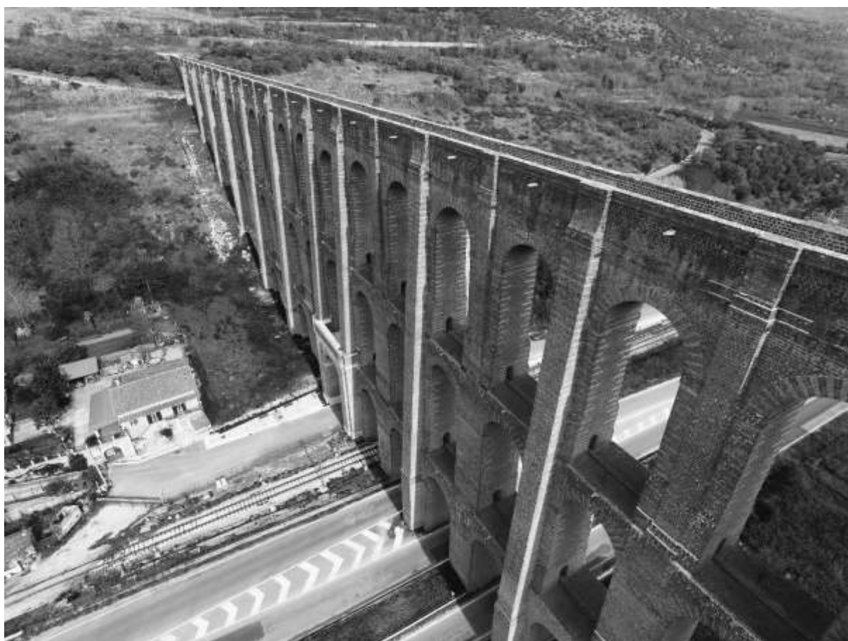
Avioripresa da drone dei Ponti della Valle

Il mondo contemporaneo e la vita nei suoi aspetti più quotidiani, negli ultimi decenni, sono stati completamente rivoluzionati da tecnologie che, in maniera evolutiva e rapida, hanno determinato, a tutti i livelli, stravolgimenti radicali, sia in termini comportamentali che abitudinali.