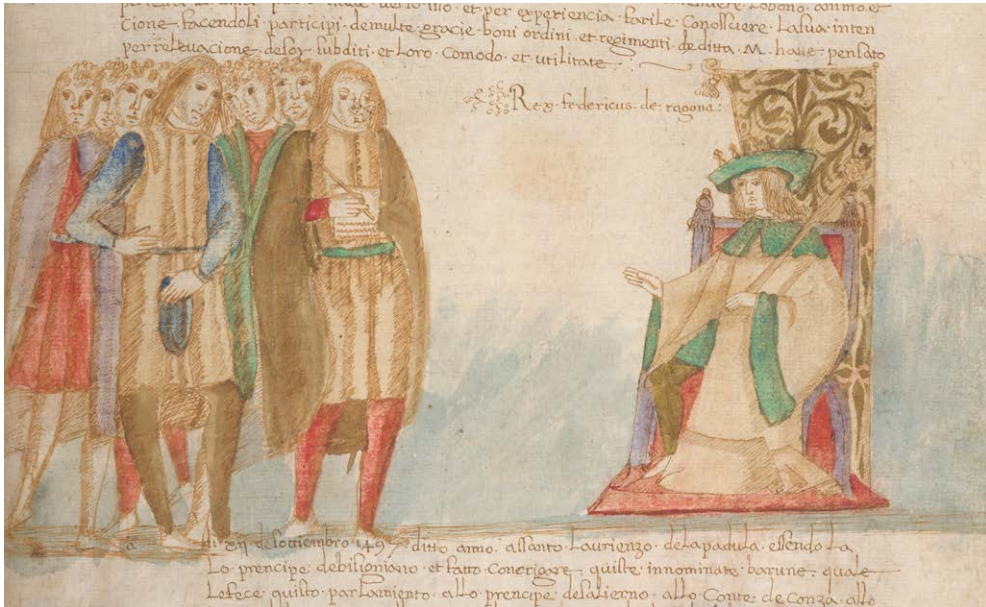
FIG. 2: Il parlamento generale del 1497, Ferraiolo, Cronaca, New York, The Pierpont Morgan Library, ms M 801, f. 148r. Riprodotto con l'autorizzazione 2018-954.

In essa Federico d'Aragona è assiso su un trono ornato riccamente e con i simboli della regalità: corona e scettro. Alla sua destra sette persone sono raggruppate, in piedi; quella più vicina al sovrano tiene in mano carta e calamo: potrebbe trattarsi del cancelliere che “verbalizzava” la seduta, come pure del portavoce dei baroni che consegna la lista delle suppliche appena vergate (anche se in tal caso ci aspetteremo di vederlo inginocchiato accanto al monarca), oppure, ma è l'ipotesi meno plausibile, dello stesso cronista che si autorappresenta, collocandosi però in un contesto nel quale non gli era consentito trovarsi, a meno che non fosse stato convocato personalmente in qualità di titolare di feudo (dato che non risulta) 92 .