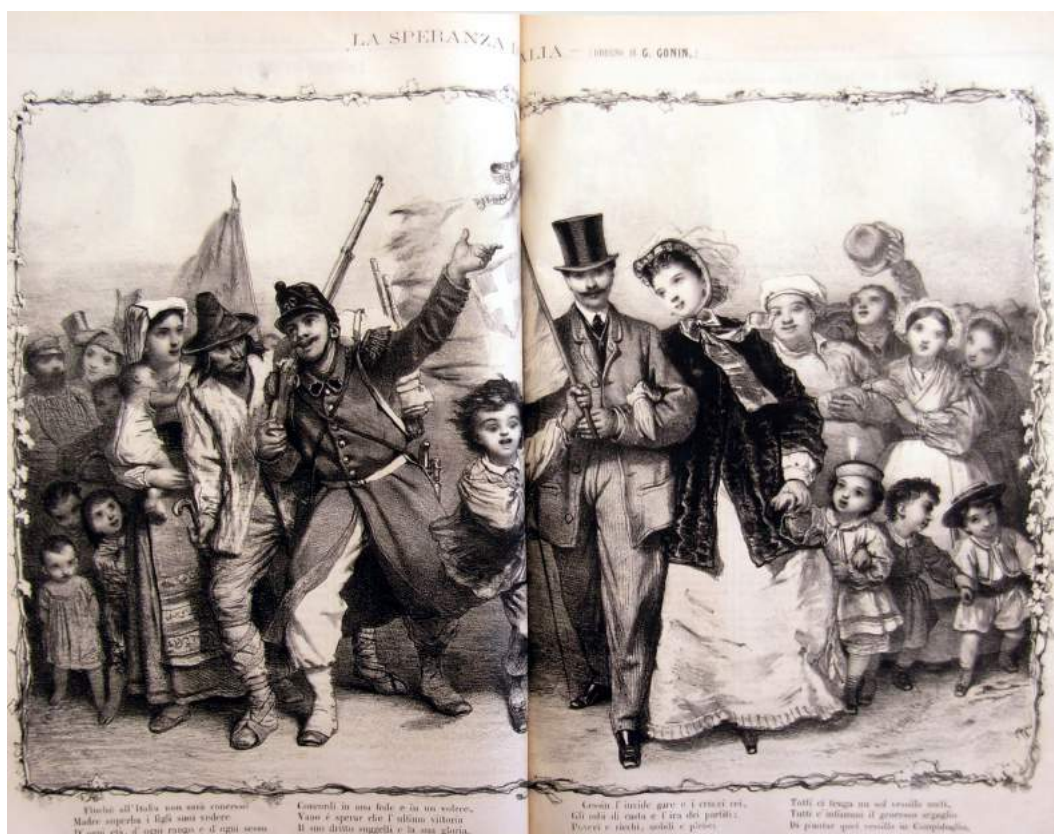
10. GUIDO GONIN, La speranza d'Italia , litografia. In «Lo spirito folletto», 2, 55, 19 giugno 1862.