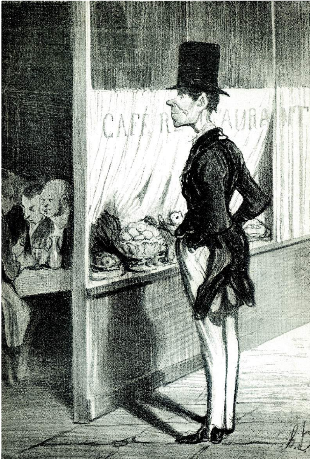
7. HONORÉ DAUMIER, « - J'ai troissous! », litografia (dalla serie delle Émotions Parisiennes ). In «Le charivari», 11 agosto 1839 (da H. FRANZ, O. UZANNE, Daumier and Gavarni , London 1904, fig. D 31).