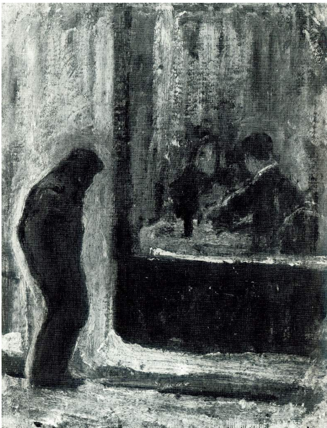
11. EMILIO LONGONI, Lo sguardo di un affamato , bozzetto, olio su tela fissato su cartone (da Mostra di Emilio Longoni , p. 249).