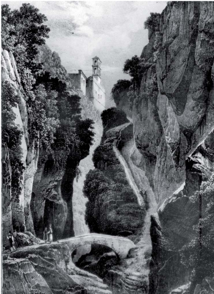
2. J.L.F. Villeneuve, Vue des Ravins de Sorrente , litografia, s.d.

fisico in grado di alimentare il mito del poeta rinascimentale; le marine grande e piccola, lette spesso con attitudine romantica; e i valloni, percorsi da sentieri tortuosi e scavalcati da esili ponticelli, legati piuttosto all'estetica del sublime. Sebbene in misura minore, molte raffigurazioni consistono in vedute dal mare della costa, in panorami della piana sullo sfondo del golfo – soprattutto dal Capo – e in episodi di architettura rurale o di resti archeologici. Nelle rappresentazioni ottocentesche quasi del tutto assente è il paesaggio agrario, fondato sulla coltivazione degli agrumi e specialmente delle arance. Pochissime notazioni, anche tra i racconti più descrittivi, riguardano le attività artigianali, come la produzione della seta o la lavorazione delle tarsie lignee.