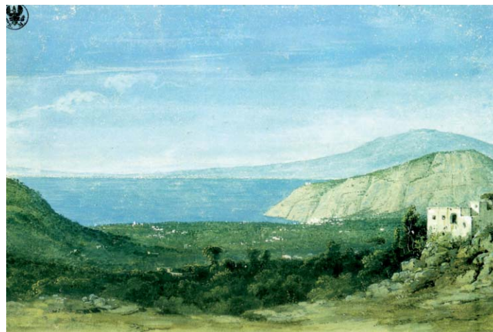
4. K.F. Schinkel, Ansicht aus der Gegend um Neapel , 1824, già datato 1804.

frendo una sorta di catalogo dei luoghi 'mirabili' e degli elementi d'interesse per un viaggiatore della prima metà dell'Ottocento. In effetti, su questi temi si registra anche l'interesse di diversi esponenti della Scuola di Posillipo e, in particolare, di Teodoro Duclère e di Giacinto Gigante, entrambi chiamati a Sorrento per insegnare la pratica del disegno a Pompeo Correale 23 . In tal caso, la relativa stanzialità induce gli artisti a ritrarre anche aspetti insoliti e meno noti, come i ruderi dell'abbazia di San Renato e il succorpo della basilica di Sant'Antonino 24 , ripresi da Duclère insieme a una notevole messe di disegni oggi confluiti nella collezione del Museo Correale 25 .