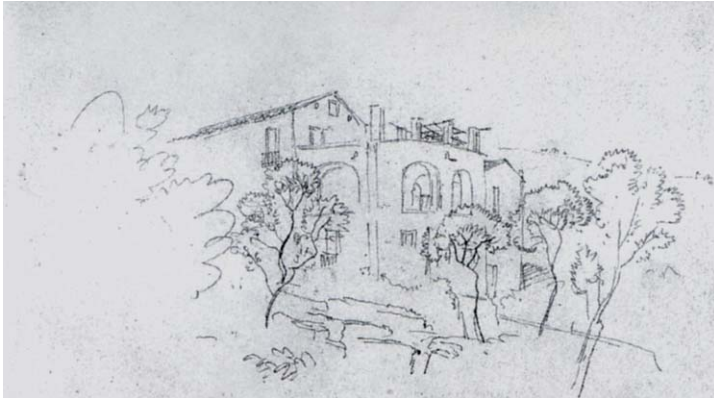
5. K.F. Schinkel, Landbaus in Sorrent , 1824, probabilmente la dépendance del Cocumella.