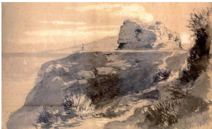
3. T. Duclère, Ruderi della torre vicereale al capo di Sorrento , 1865.

La presenza di resti archeologici costituisce un ulteriore elemento di interesse per ogni categoria di viaggiatore colto 21 . Lo stesso Turpin de Crissé si sofferma nella descrizione di quelle che considera tombe greche e, inoltre, ritiene di individuare i resti di diversi templi antichi, da quello di Nettuno, sul mare al di sotto della casa del Tasso, a quello di Venere e a quello di Ercole 22 . Le incisioni pubblicate da Turpin de Crissé nel suo volume dedicato alle bellezze del Golfo di Napoli sono assai significative: di Sorrento pubblica nel 1828 immagini della Casa del Tasso, delle marine, del vallone e appunto di alcuni resti archeologici. In tal modo, egli si sofferma su tutti i principali tòpoi della costiera, of-