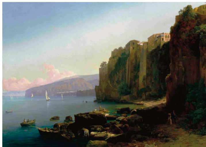
1. Th. Ender, Il golfo di Sorrento , 1819-1822; in alto a destra si può notare la Casa del Tasso con la terrazza affacciata sul mare (collezione Liechtenstein).

La costruzione della strada agevola senz’altro lo sviluppo turistico e, oltre a un cospicuo numero di stranieri, sono anche i ‘villeggianti’ provenienti da Napoli ad affollare la cittadina nel corso della ‘stagione’. Quello dello sviluppo turistico è un fenomeno che durante il XIX secolo conosce a Sorrento non solo un graduale e inarrestabile incremento sul piano quantitativo, ma anche diversi salti di qualità. Se nei primi decenni dell’Ottocento l’unica struttura alberghiera era il Cocumella, seguito poi dal Syrène, alla fine del secolo gli alberghi presenti in città sono già moltissimi, di categoria e prezzi differenziati e con clientele assai eterogenee. Il numero di viaggiatori e turisti, tra la fine del XVIII secolo e la fine del successivo, cresce enormemente, mentre cambia lo sguardo su Sorrento e sul suo territorio. Tuttavia, si possono agevolmente identificare alcuni tòpoi nelle rappresentazioni grafiche e nei racconti dei viaggiatori: in primis la Casa del Tasso, l’unico elemento