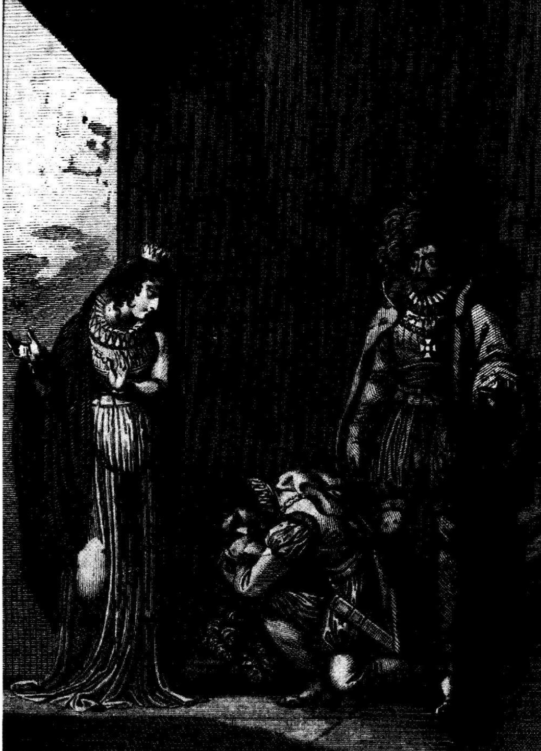
Illustration zu „Don Karlos“. Kupferstich aus der „Don Karlos“-Ausgabe von 1802.

nur in der melancholischen Verslossenheit, auch in der Begegnungsszene mit der Königin (I,5) verrät sich neben dem Zwangscharakter ihre Egozentrik, als Carlos nur mit Mühe daran gehindert wird, die Königin fast ebenso wie Ferdinand seine geliebte Luise mit ins Unglück zu ziehen. Ins Urteil Posas fließt daher auch die Kenntnis der Liebesphilosophie des Julius ein: „Ja einst, / (...). Da warst du so reich, / (...) Ein ganzer Weltkreis hatte / In deinem weiten Busen Raum. Das alles / Ist nun dahin, von einer Leidenschaft, / Von einem kleinen Eigennutz ver-