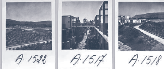
A. 1522 A. 1517 A. 1518