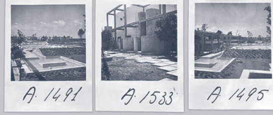
A. 1491 A. 1533 A. 1495