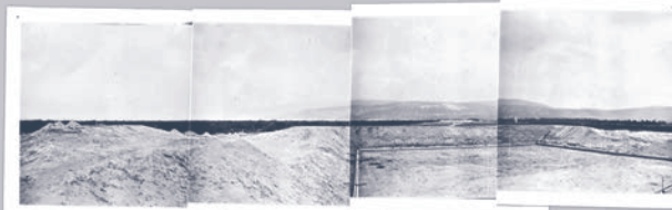
A/342 A/337 A/335 A/334