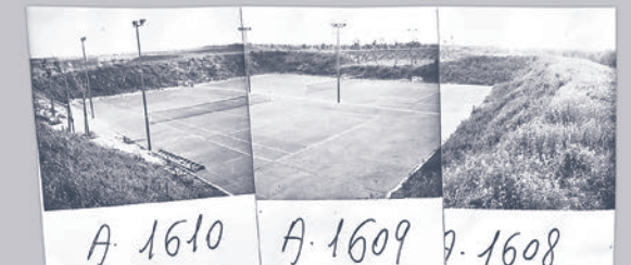
A. 1610 A. 1609 A. 1608