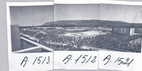
A. 1513 A. 1512 A. 1521