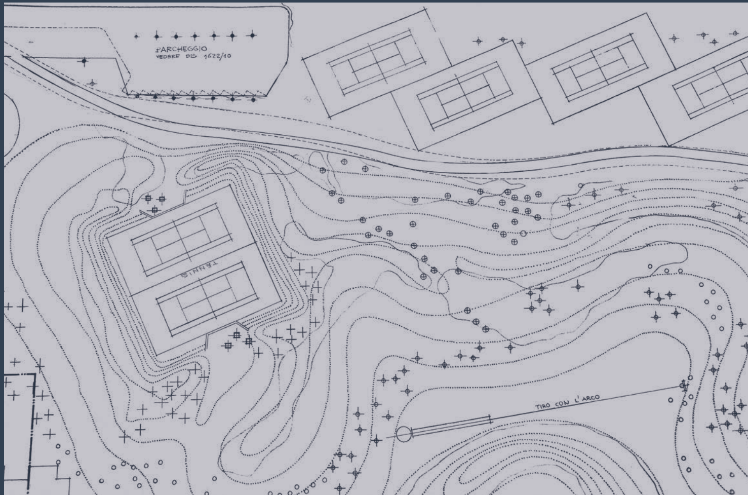
Pietro Porcinai, Villaggio turistico di | Tourist village resort of Nicotera Marina, planimetria delle dune artificiali nell'area sportiva | plan of the artificial dunes in the sports area. Archivio Pietro Porcinai, disegno | drawing 1622/24.