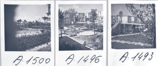
A. 1500 A. 1496 A. 1493