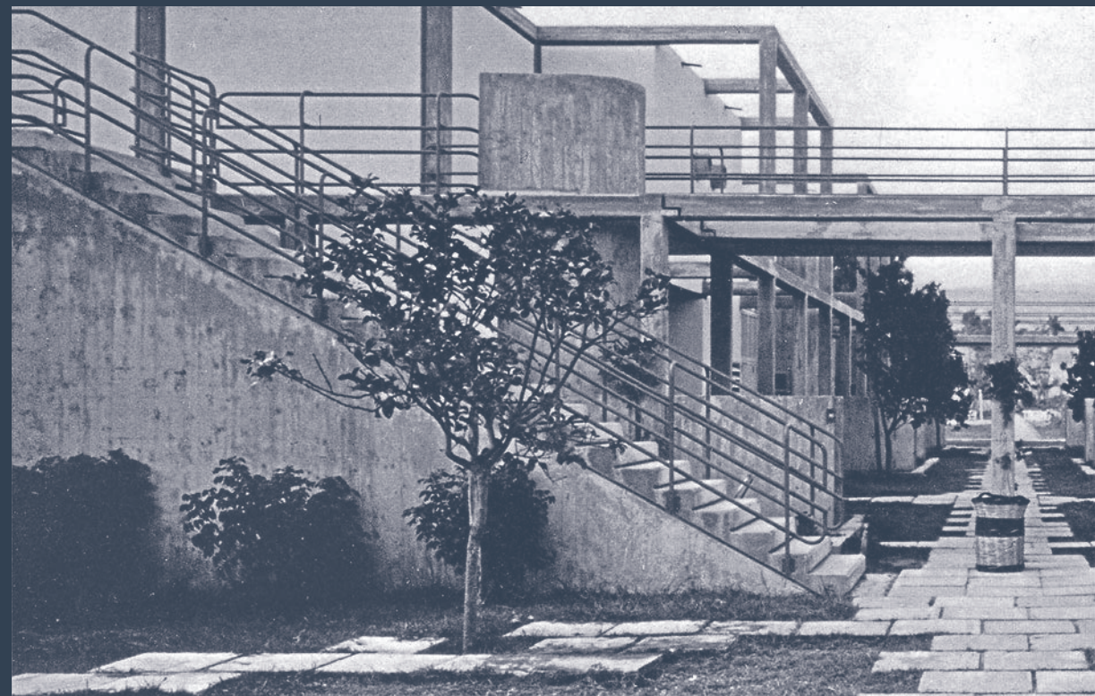
Villaggio turistico di | Tourist village resort of Nicotera Marina negli anni Settanta | in 1970s. In F. Oliva, Villaggio turistico a Nicotera, Catanzaro , in "L'architettura. Cronache e storia", no. 199, maggio | May 1972, p. 14.