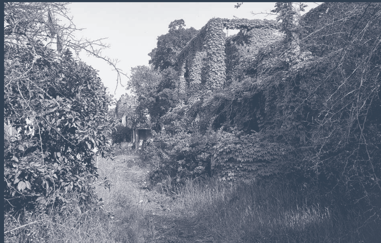
Villaggio turistico di | Tourist village resort of Nicotera Marina oggi | today. agosto | August 2023.