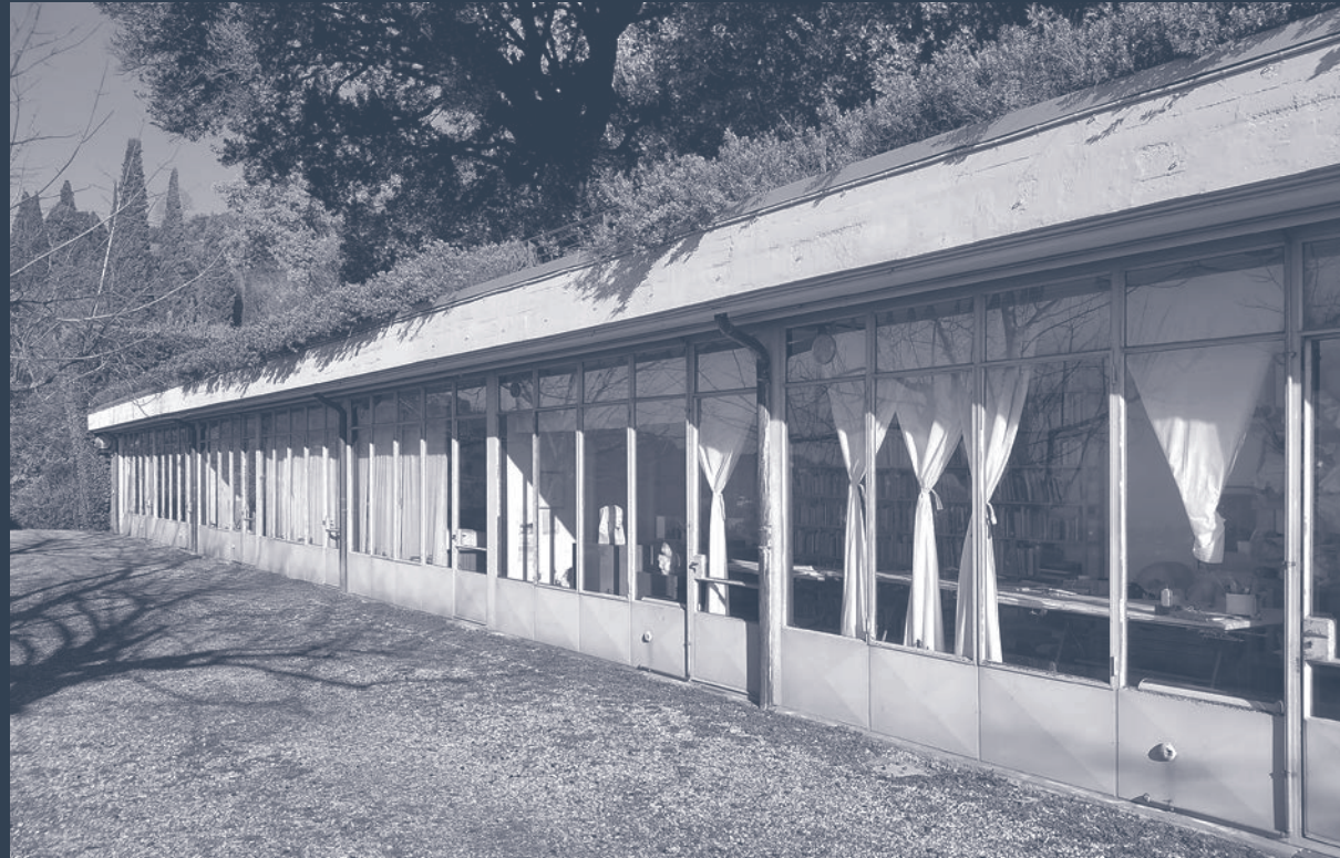
Esterno dello studio-archivio di Pietro Porcinai nel parco di Villa Rondinelli a San Domenico, Fiesole - Firenze | Exterior of Pietro Porcinai's studio-archives in the park of Villa Rondinelli in San Domenico, Fiesole - Florence. dicembre | December 2023.