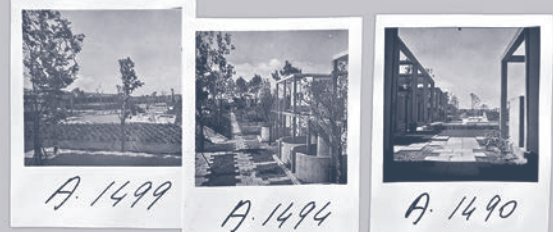
A. 1499 A. 1494 A. 1490