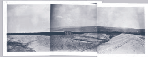
A/352 A/345 A/344