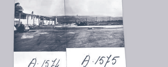
A. 1574 A. 1575