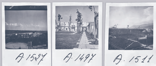
A. 1527 A. 1497 A. 1511