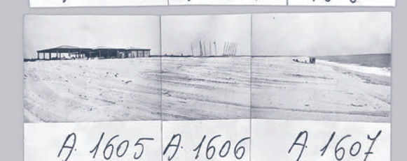
A. 1605 A. 1606 A. 1607