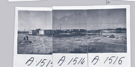
A. 151 A. 1514 A. 1516