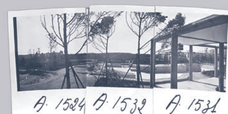
A. 1524 A. 1532 A. 1531