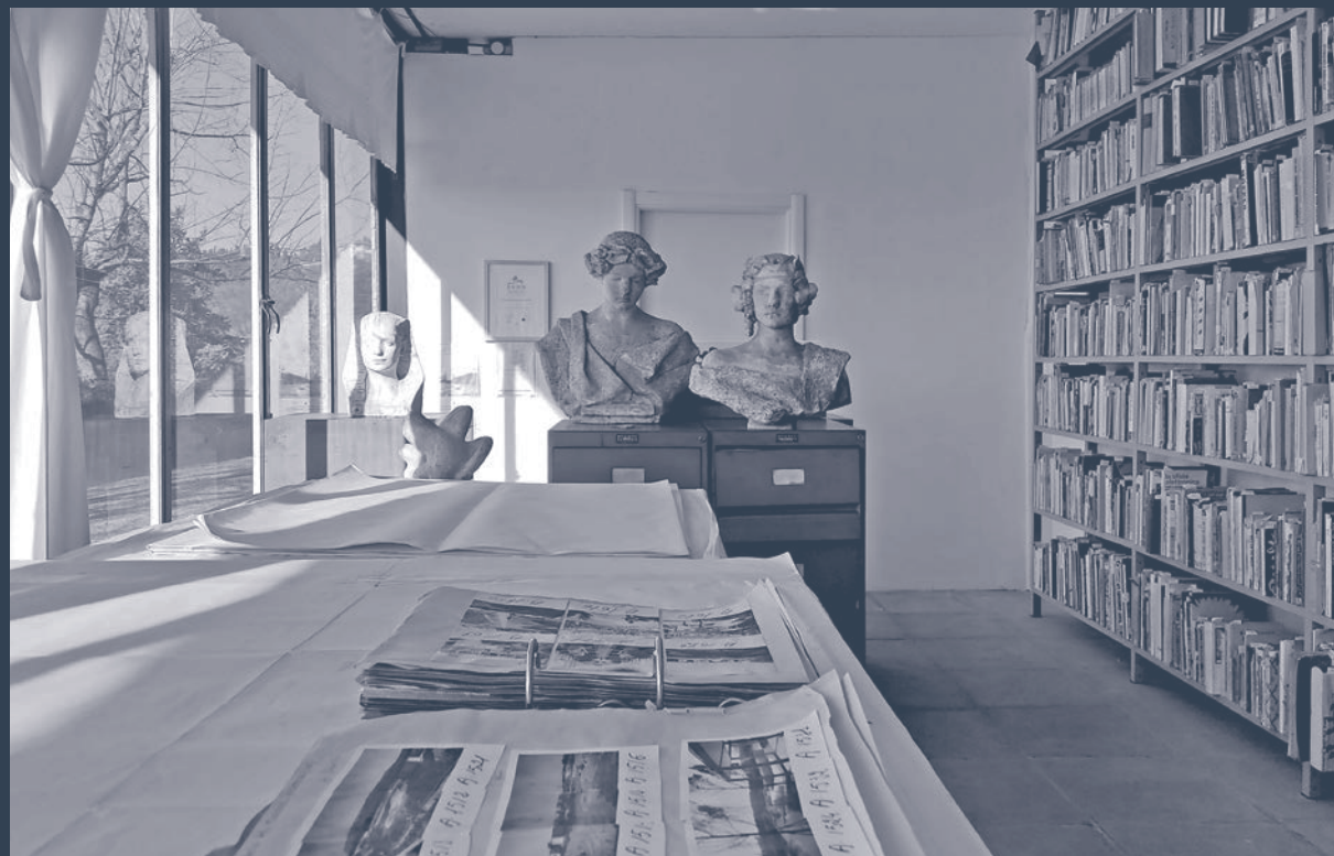
Interno dello studio-archivio di Pietro Porcinai nel parco di Villa Rondinelli a San Domenico, Fiesole - Firenze | Interior of Pietro Porcinai's studio-archives in the park of Villa Rondinelli in San Domenico, Fiesole - Florence. dicembre | December 2023.

sociale della cittadina di Nicotera Marina che, nel frattempo, non solo non ha conosciuto l'auspicato sviluppo turistico ed economico indotto dal villaggio, ma sembra anch'essa destinata a un inesorabile declino economico e sociale. A seguito della chiusura si assiste alla mobilitazione di studiosi, di intellettuali, della società civile locale e nazionale, del mondo dell'associazionismo per evitare che l'intero complesso venga dimenticato 17 , alterato o peggio demolito per far posto a insediamenti turistici speculativi. La mobilitazione ha un esito positivo e ottiene il riconoscimento per il villaggio turistico di Nicotera Marina dello status di bene di particolare interesse paesaggistico e architettonico 18 .