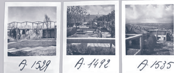
A. 1529 A. 1492 A. 1535