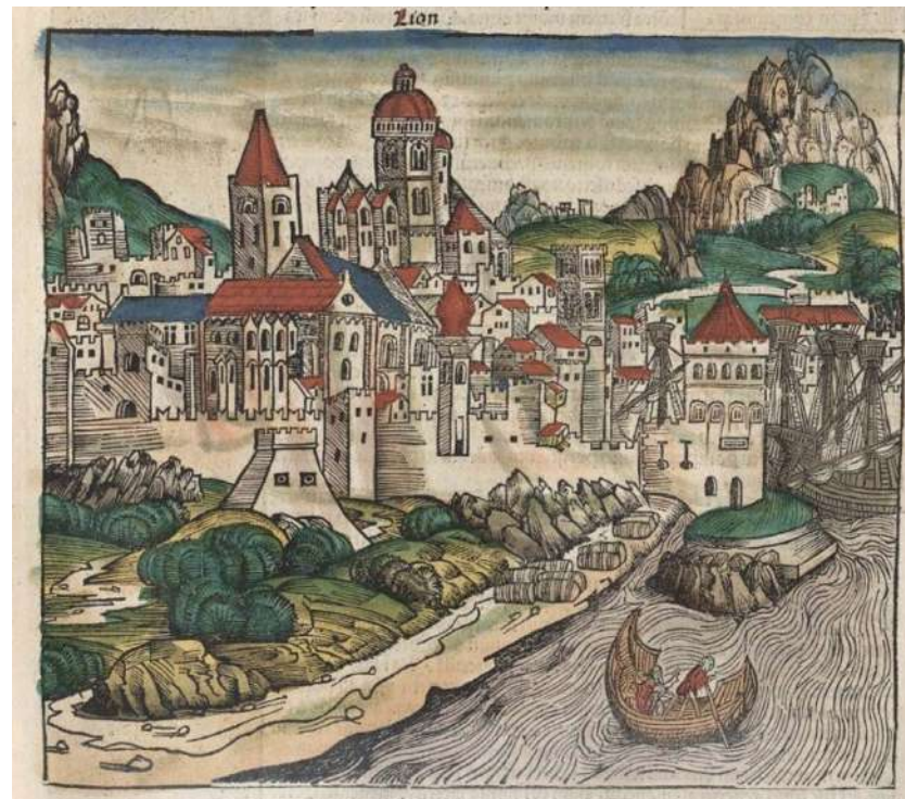
Fig. 3: «Lion», in Schedel 1493, c. LXXXVIII.

duta non solo della stessa Candia ma anche di altre città, fra cui Bologna, Lione, Aquileia e Mainz: queste ultime, infatti, pur rappresentando città diverse appaiono perfettamente sovrapponibili poiché ricavate da una stessa matrice (figg. 2, 3) [Georg Braun, Francis Hogenberg 2015, 11-13]. Alcune vedute di Candia edite a partire dal Cinquecento offrono un disegno talvolta molto semplificato rispetto a quella di Reuwich, come l'immagine realizzata dal francescano Niccolò da Poggibonsi, autore di un pellegrinaggio a Gerusalemme fra il 1346 e il 1350, contenuta nel suo resoconto che ebbe un'amplissima circolazione [da Poggibonsi 1519, c. 11]; ancora, deve citarsi il disegno del pittore e incisore Francesco Valegio (1570-1650 ca.) incluso nella sua raccolta di vedute e piante prospettiche, anche se si tratta piuttosto di un bozzetto [Valegio 1600, c. 49]. Sempre a partire dal modello di Reuwich, viceversa, altre rappresentazioni restituirono un disegno più accurato di Candia e giunsero a rinnovarlo attraverso la progressiva manipolazione di elementi dell'architettura e del paesaggio, mettendo a punto un'immagine che si sarebbe rivelata assai duratura fino a tutto il Seicento. In questo saggio ci si soffermerà proprio su alcuni di questi disegni, cercando di individuare anche possibili riferimenti utilizzati dagli incisori come base per le loro vedute più o meno aggiornate della città.