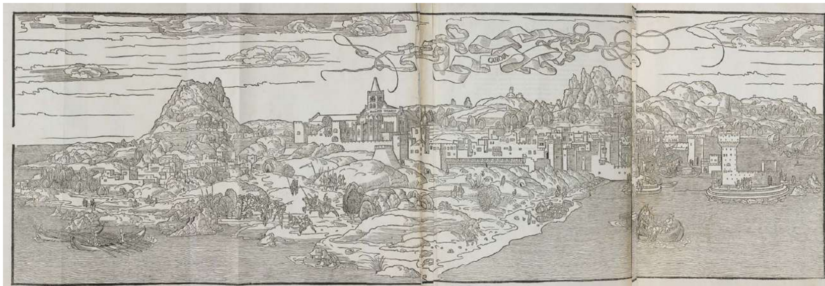
Fig. 1: «Candia», in von Breyenbach 1486, c. 54.

campanile a base quadrata con monofore nella parte alta e una cuspid e a bulbo (forse, in questo caso, proprio il campanile della cappella ducale di San Marco) e, soprattutto, il convento di San Francesco: di quest'ultimo si riconoscono la chiesa a pianta basilicale con abside poligonale merlata e il campanile a base quadrata, anch'esso merlato, con due ordini di bifore e una cuspid e troncoconica, altrove riferito a San Marco [Georg Braun, Francis Hogenberg 2015, 11]; un cartiglio reca la scritta «Conventus minorum». Oltre le mura, a est della città ovvero nella parte sinistra della veduta, un gruppo di case raffigura il sobborgo di Marula che continuò a esistere fino a metà del Seicento, quando fu distrutto nel corso del lungo assedio ottomano. Ai piedi di un'altura, poi, si scorge una grande chiesa a pianta centrale cupolata: si tratta con ogni probabilità del convento di Santa Caterina del Monte Sinai, proprietario di numerosi beni a Candia e nei dintorni, che sarebbe stato poi inglobato nel nuovo perimetro murario bastionato. A tale proposito, al pari di altri incisori coevi, Reuwich distingue le chiese di rito latino da quelle greche, rappresentando le prime a pianta basilicale con tetto a doppia falda, le seconde a pianta centrale cupolata, e ribadisce implicitamente il primato della Serenissima dando massimo rilievo alle chiese latine e alle mura veneziane [Georgopoulou 2001, 30].