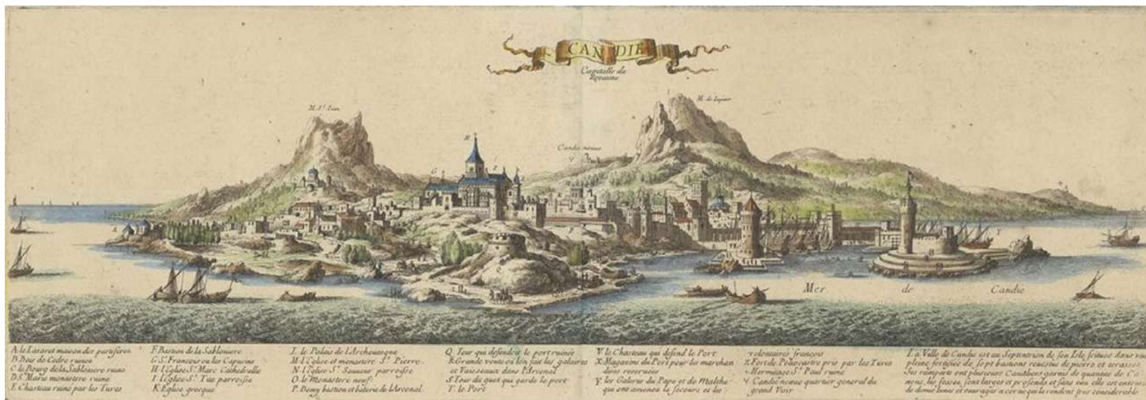
Fig. 6: «Candie, Capitale du Royaume», in Beaulieu de Pontault 1667.