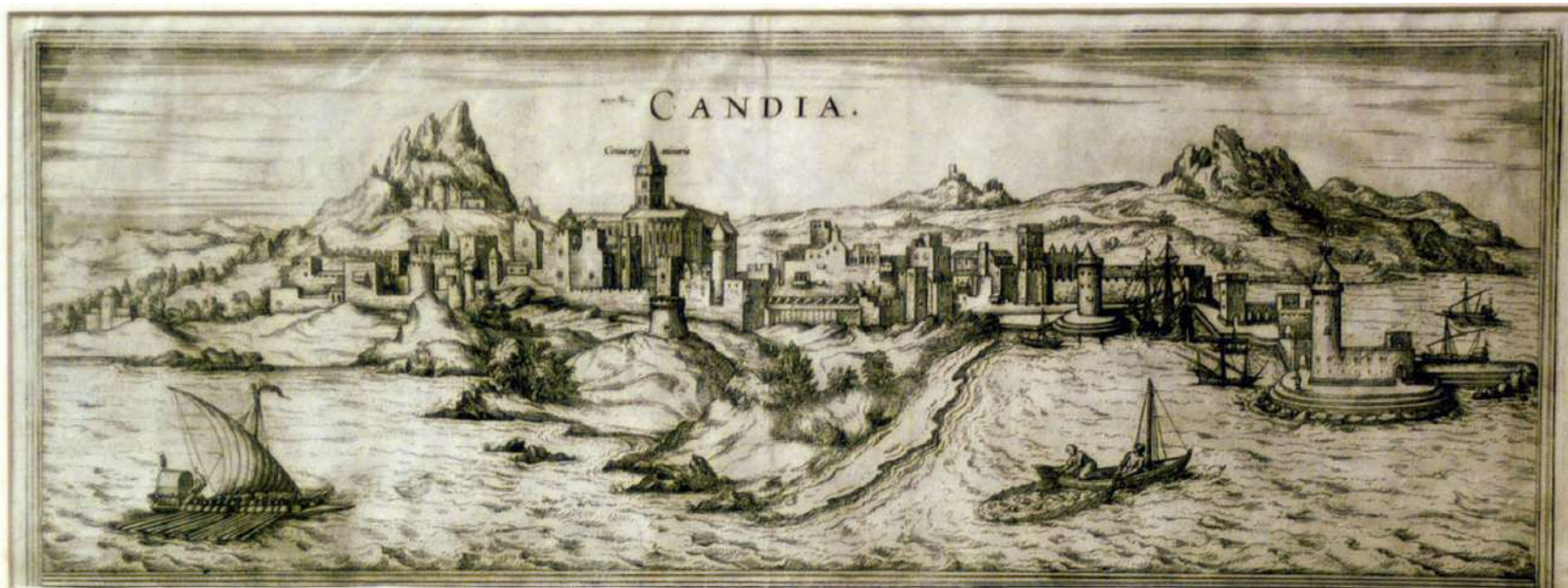
Fig. 4: «Candia», in Braun, Hege 1572-1617, vol. 2, c. 53.