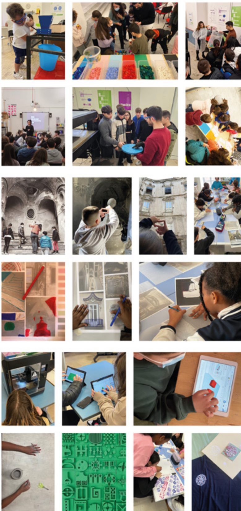
1. Momenti laboratoriali della prima fase dei percorsi educativi: attività per il pensiero ecologico, attività di cacce fotografiche per il riconoscimento dei segni del territorio e la rielaborazione grafica attraverso strumenti analogici, attività di interazione con strumenti digitali (Tinkercad – Software CAD open source – stampanti 3D FDM), prodotti realizzati dai partecipanti.

L'approccio ludico, l'attivismo inteso come uso della pratica per il raggiungimento dell'apprendimento e il design inteso come strumento di empowerment , hanno l'obiettivo di coinvolgere il bambino in un processo capacitante, stimolando l'assunzione di un protagonismo nella produzione di cambiamenti positivi. (FIG. 1)