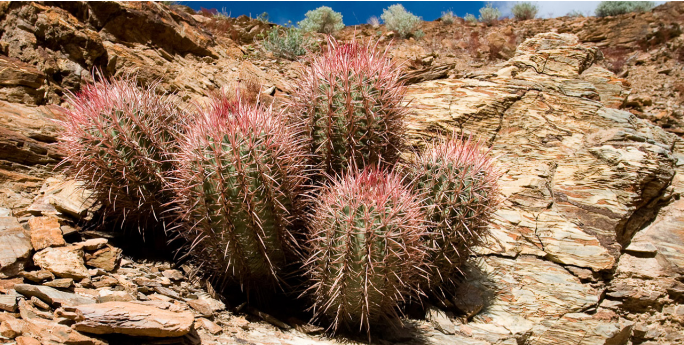
Death Valley. Fotografía de Greg Willis