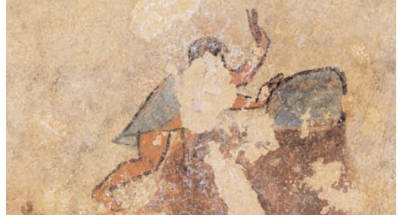
2. Tarquinia, necropoli dei Monterozzi, Tomba della Caccia e della Pesca. Particolare (da STEINGRÄBER 1984, n. 50).