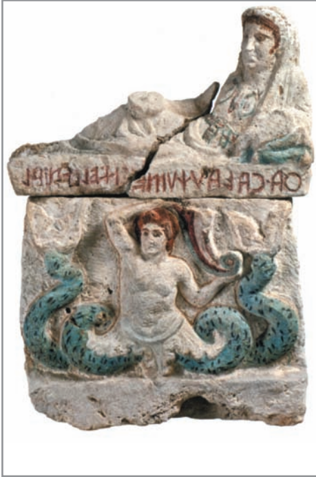
1. Perugia, necropoli di Strozzeacaponi di Corciano, Tomba del "Letto Funebre". Urna funeraria con Scilla (da CENCIAIOLI 2010, p. 16).