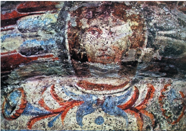
5. Vulci, Tomba François. Protome femminile con elemento floreale al di sopra della cella IX (da BIANCHI BANDINELLI - GIULIANO 1973, p. 258).