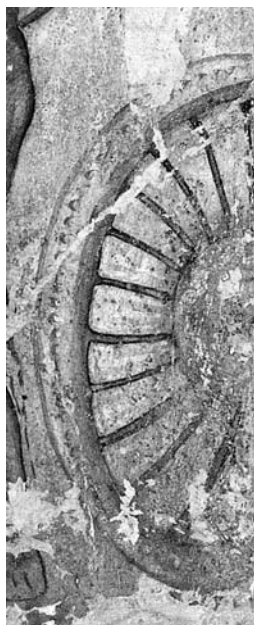
Fig. 2. Vulci, Tomba François. Lo scudo alla sinistra dell'ingresso alla cella VII (da ANDREAE 2004a, p. 193, dettaglio).

è realizzato con tratti sottili e regolari; lo si può osservare, partendo dalle pitture del tablino e procedendo in senso orario: