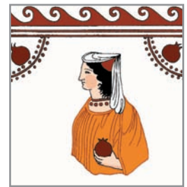
4. Ipotetica restituzione della tomba Weege 4 con i colori originali.