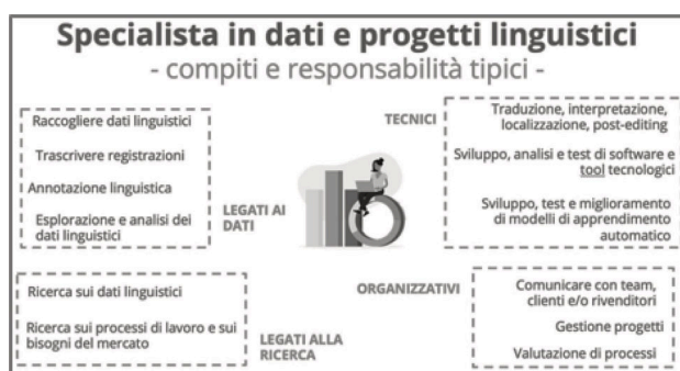
Figura 1. Compiti e competenze dello/la specialista in dati e progetti linguistici 2

Il profilo dello/la specialista in dati e progetti linguistici che è emerso dall'analisi dei bisogni così condotta non è inteso come legato a una singola posizione lavorativa, né come il titolo di un nuovo corso di studio. Si tratta di un profilo appositamente generico, modulare e adattabile alle esigenze di diversi corsi di studio e diverse posizioni nel mercato del lavoro. Allo scopo di mantenere questa fondamentale flessibilità, le implicazioni formative sono state strutturate intorno a due dimensioni: una dimensione verticale focalizzata sui sette ambiti principali individuati nell'analisi dei bisogni del progetto UPSKILLS (ambito disciplinare, (inter)culturale, tecnologico, legato ai dati, legato alla ricerca, organizzativo e trasversale) e una orizzontale basata sugli elementi standard dei risultati dell'apprendimento (conoscenze, abilità e competenze). L'idea centrale del profilo è di costituire una guida nella scelta delle conoscenze, abilità e competenze da conseguire/insegnare, tenendo presente che la maggior parte delle nuove posizioni lavorative nel settore richiedono un contributo maggiore o minore da ciascuno dei sette ambiti. I principali compiti e responsabilità da un lato, e le principali conoscenze, abilità e competenze dall'altro, possono essere riassunte come nelle figure 1 - 2.