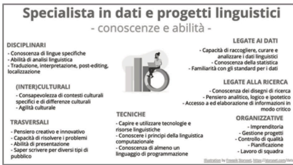
Figura 2. Compiti e competenze dello/a specialista in dati e progetti linguistici

Sono inoltre stati definiti quattro sottoprofili più specifici, a seconda che il focus sia più sulla ricerca ( analista di dati linguistici e scienziato/a dei dati linguistici ) oppure sulla gestione di progetti ( manager di dati linguistici e manager di progetti linguistici ), e a seconda del livello di responsabilità e dell’esperienza lavorativa (minori per l’analista e il/la manager di dati linguistici, maggiori per lo/la scienziato/a dei dati linguistici e il/la manager di progetti linguistici). La figura 3 presenta a titolo esemplificativo alcuni compiti e responsabilità legati ai sottoprofili. Le relative competenze sono sottoinsiemi a geometria variabile di quelle proprie del profilo più generale. Maggiori informazioni su profili e sottoprofili, così come sulla metodologia e i risultati dell’analisi dei bisogni sono reperibili in Miličević Petrović et al. (2021).