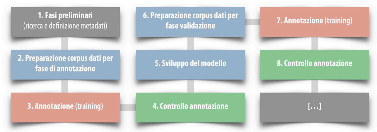
Figura 1. Fasi del processo di annotazione e sviluppo: un esempio a nostra cura.

L'apprendimento supervisionato della macchina e la figura dell'annotatore sono quindi, a nostro avviso, imprescindibili per il mercato dell'IA.