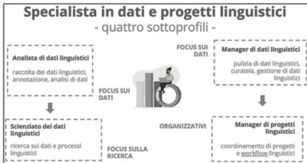
Figura 3. Responsabilità e compiti legati ai quattro sottoprofili (fonte: https://upskillsproject.eu/wp-content/uploads/2021/09/sess1.pres7_.Profile.pdf )

Sono inoltre stati definiti quattro sottoprofili più specifici, a seconda che il focus sia più sulla ricerca ( analista di dati linguistici e scienziato/a dei dati linguistici ) oppure sulla gestione di progetti ( manager di dati linguistici e manager di progetti linguistici ), e a seconda del livello di responsabilità e dell’esperienza lavorativa (minori per l’analista e il/la manager di dati linguistici, maggiori per lo/la scienziato/a dei dati linguistici e il/la manager di progetti linguistici). La figura 3 presenta a titolo esemplificativo alcuni compiti e responsabilità legati ai sottoprofili. Le relative competenze sono sottoinsiemi a geometria variabile di quelle proprie del profilo più generale. Maggiori informazioni su profili e sottoprofili, così come sulla metodologia e i risultati dell’analisi dei bisogni sono reperibili in Miličević Petrović et al. (2021).