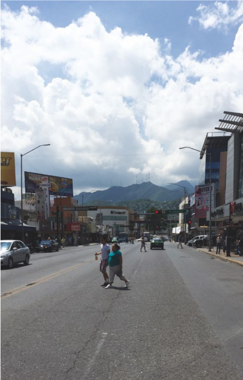
Veduta di Monterrey