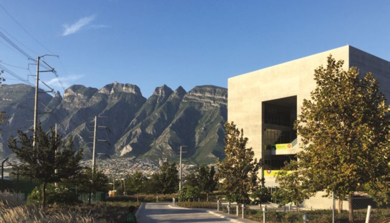
Veduta di Monterrey

contemporanea, sembrano inadeguati di fronte a una città come Monterrey. Non ci sono in questa provincia messicana aree ordinatamente distinte che seguono e parcellizzano il territorio, periferie urbane alla ricerca di un paesaggio di qualità, ma nella “ ciudad de las montañas ”, come è chiamata dai messicani stessi, l’intersezione fra l’infrastruttura, la geografia e le aree edificate, residenziali, terziarie, industriali, disegna un paesaggio urbano unico, forse si può azzardare un paesaggio con caratteristiche di indifferenza tra le sue parti che, nel tempo, hanno costruito una nuova forma di solidarietà.