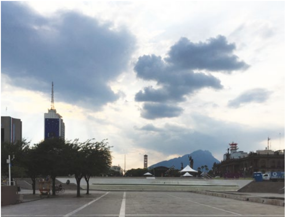
Veduta di Monterrey

mezzo di trasporto, automobili di grandi dimensioni come SUV e pick-up statunitensi sono i mezzi più diffusi, la recente rete della metropolitana ha due sole linee e serve un'area minima della città. Le infrastrutture viarie di trasporto sono elementi fondamentali, non solo nastri e nodi di connessione, ma veri e propri elementi dell'identità urbana. Il centro storico della città, meglio quello che rimane della fondazione tardo cinquecentesca, si adagia nella parte centrale e più pianeggiante, brani di tessuto antico si alternano a recenti interventi di trasformazione urbana, il più importante è la Macroplaza, realizzata negli anni '80 del secolo scorso, un sistema di piazze e giardini a diverse quote ai cui bordi si trovano molti edifici pubblici; è questa un'area che si sta svuotando, in pochi vogliono abitare in questa zona