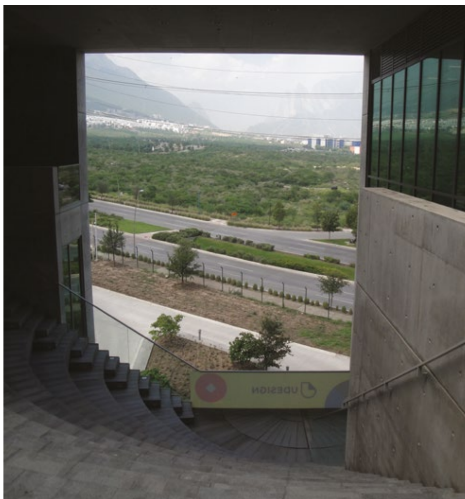
Tadao Ando, Centro Roberto Garza Sada de Arte, Arquitectura y Diseño dell'Università di Monterrey, 2013

quali il messicano medio si ritrova perfettamente.