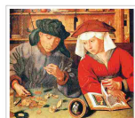
RIVISTA BANCARIA MINERVA BANCARIA