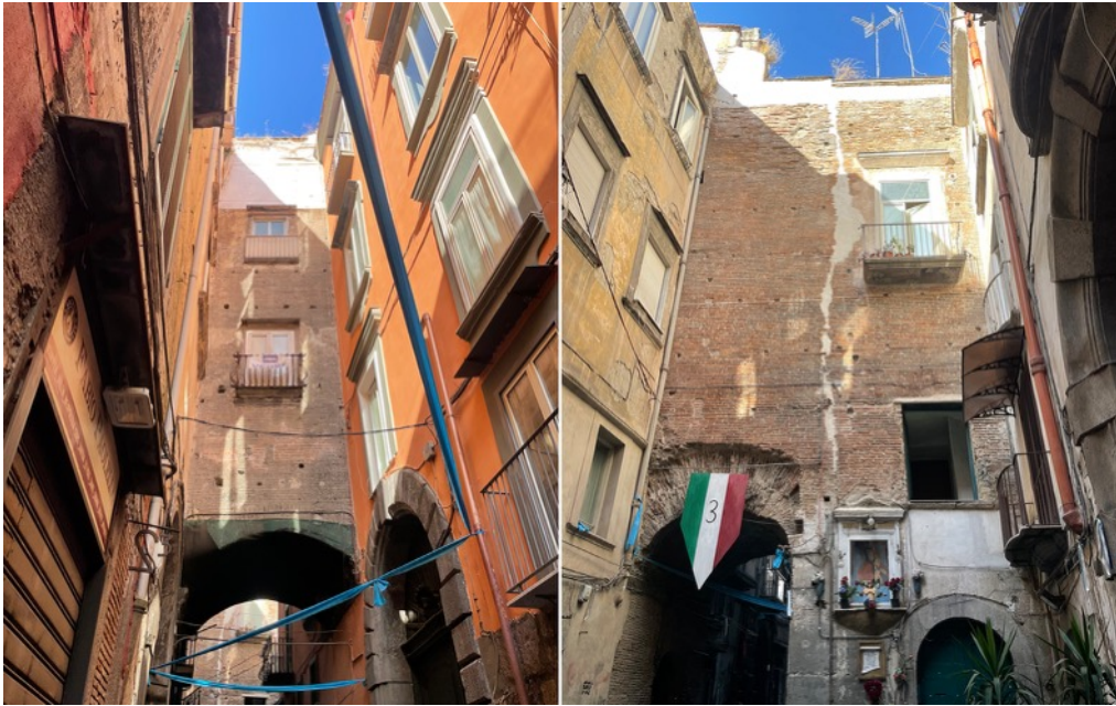
1: R. Amore, Napoli, via Anticaglia. Strutture di consolidamento del III-IV dell'antico Teatro romano di Neapolis . 2023.

fondendosi in un palinsesto ricco e complesso di brani architettonici, un frammento urbano unico (Fig. 2).