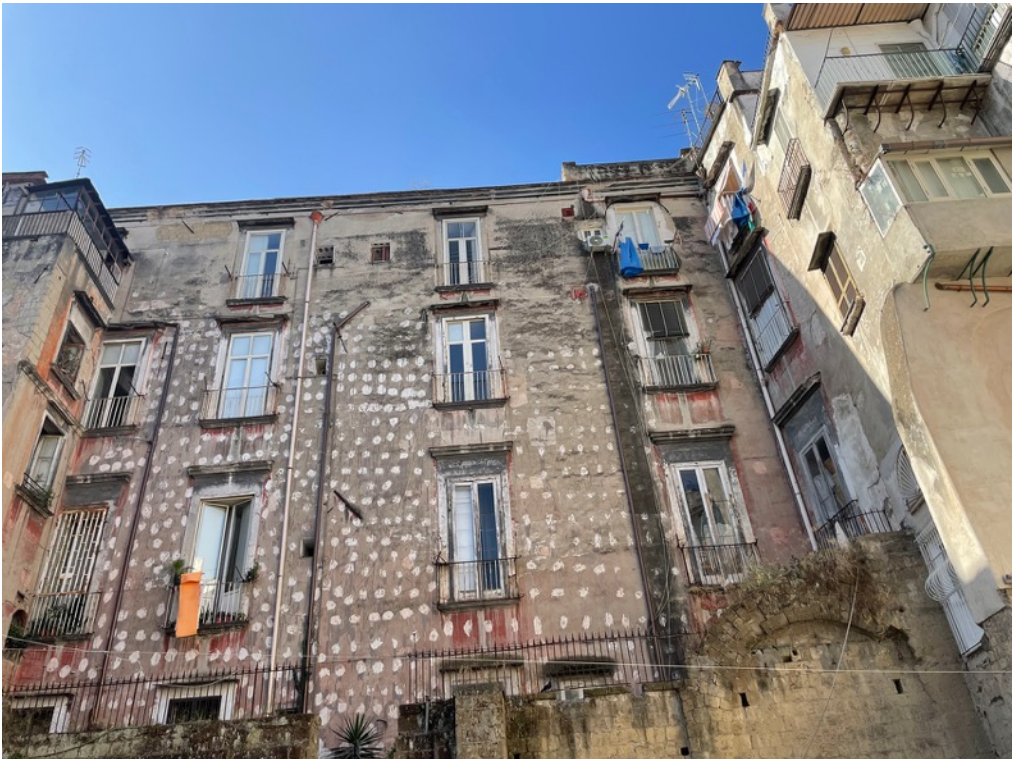
5: R. Amore, Napoli, Teatro romano di Neapolis . Vista di uno degli edifici prospicienti la cavea. 2023.

Far coesistere e far leggere le diverse stratificazioni, rinunciando sin da principio a qualsivoglia intenzione di liberare i resti monumentali del teatro sono criteri e finalità progettuali condivisibili, in sintonia con un approccio critico al tema del restauro architettonico. Ciò posto, a mio avviso, la qualità finale delle opere in corso non sarà determinata dal trattamento delle strutture e delle finiture delle parti archeologiche per le quali c'è una diffusa e condivisa prassi operativa che rassicura, ma da come saranno risolte le questioni funzionali e distributive e da come saranno affrontati gli aspetti più strettamente legati al restauro architettonico delle costruzioni di epoca successiva.