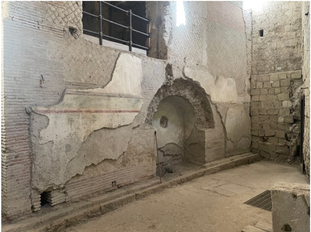
4: R. Amore, Napoli, Teatro romano di Neapolis . Vista dell'ambulacro interno con frammenti degli intonaci originari. 2023.

in generale, della cittadinanza nel suo complesso. In questi trent'anni solo per un periodo molto limitato sono state organizzate visite in cantiere e/o manifestazioni pubbliche. Dunque, un primo sforzo dovrebbe essere rivolto a far conoscere quanto è stato realizzato e quanto si intende realizzare ad un numero di cittadini sempre maggiore, per contribuire a "costruire" una comunità di patrimonio sempre più ampia e consapevole, nella convinzione che alla base di fruttuose politiche di conservazione dei beni culturali c'è sempre la conoscenza condivisa del patrimonio.