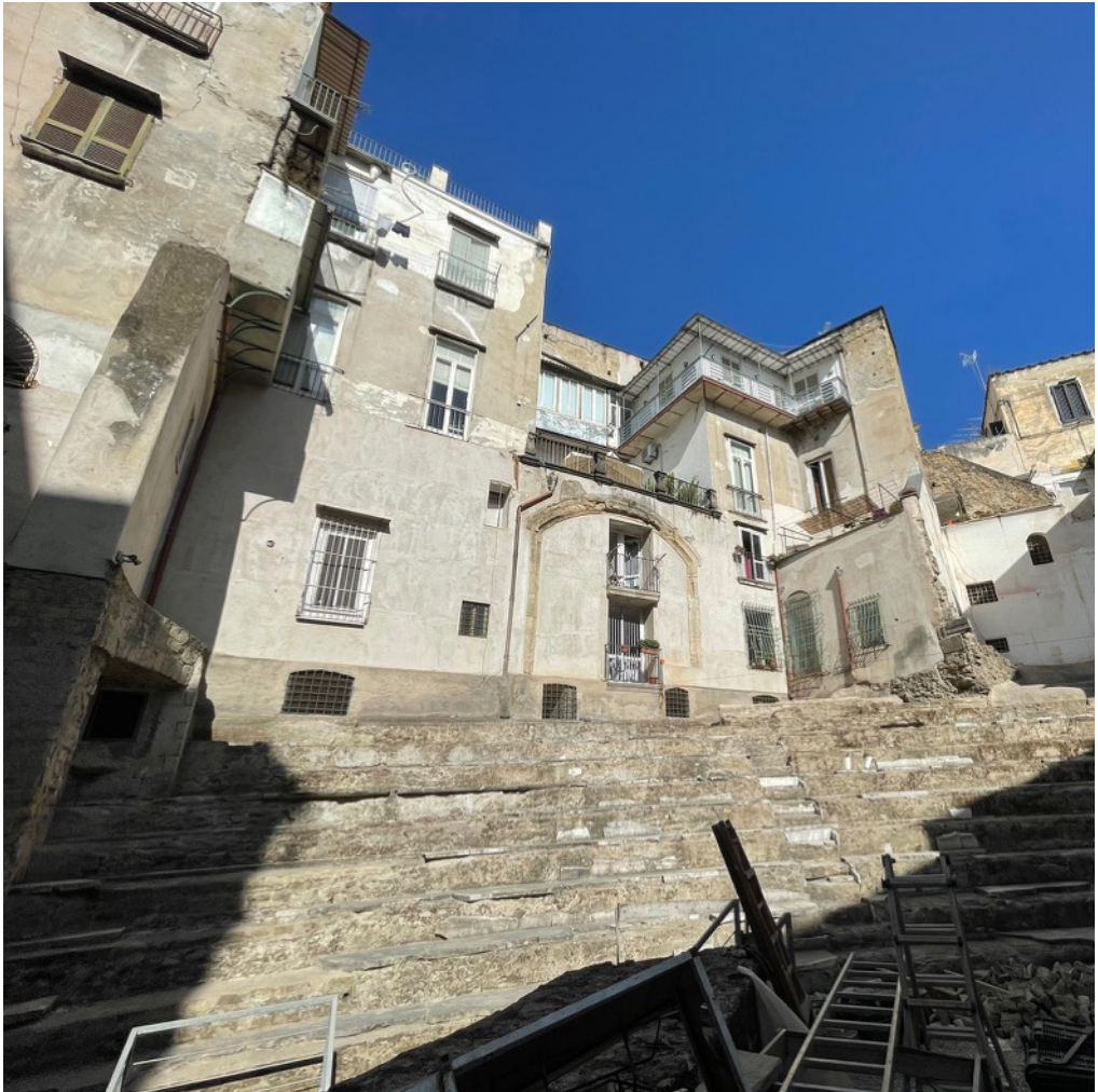
2: R. Amore, Napoli, Teatro romano di Neapolis . Vista della cavea. 2023.

183-201; Mele 2014, 146-147], Pozzuoli (Dicearchia) e Miseno – ben presto Parthenope assunse un ruolo primario. È opinione condivisa tra gli archeologi che negli anni finali del VI secolo a.C. il sito di Parthenope [Gianpaola, Greco 2022, 50-53] fu più o meno lentamente abbandonato o distrutto [Greco 2017, 260-265; D’Onofrio 2017, 27-49] e, più o meno contestualmente, fu fondato un nuovo insediamento sul pianoro corrispondente all’attuale centro antico. Ciò appare confermato dal fatto che la nuova città – che, probabilmente, per qualche generazione ha convissuto con la prima Parthenope, nell’ottica di un processo di poligenesi lungo e complesso [D’Onofrio 2017, 46] e che prenderà il nome di Neapolis solo più tardi, quando un ulteriore gruppo di époikoi ateniesi vi si trasferirà alla metà del V secolo a.C. [Luongo, Tauro 2017; Mele 2023] – già a partire dalla prima metà del V secolo assunse un ruolo prioritario nei