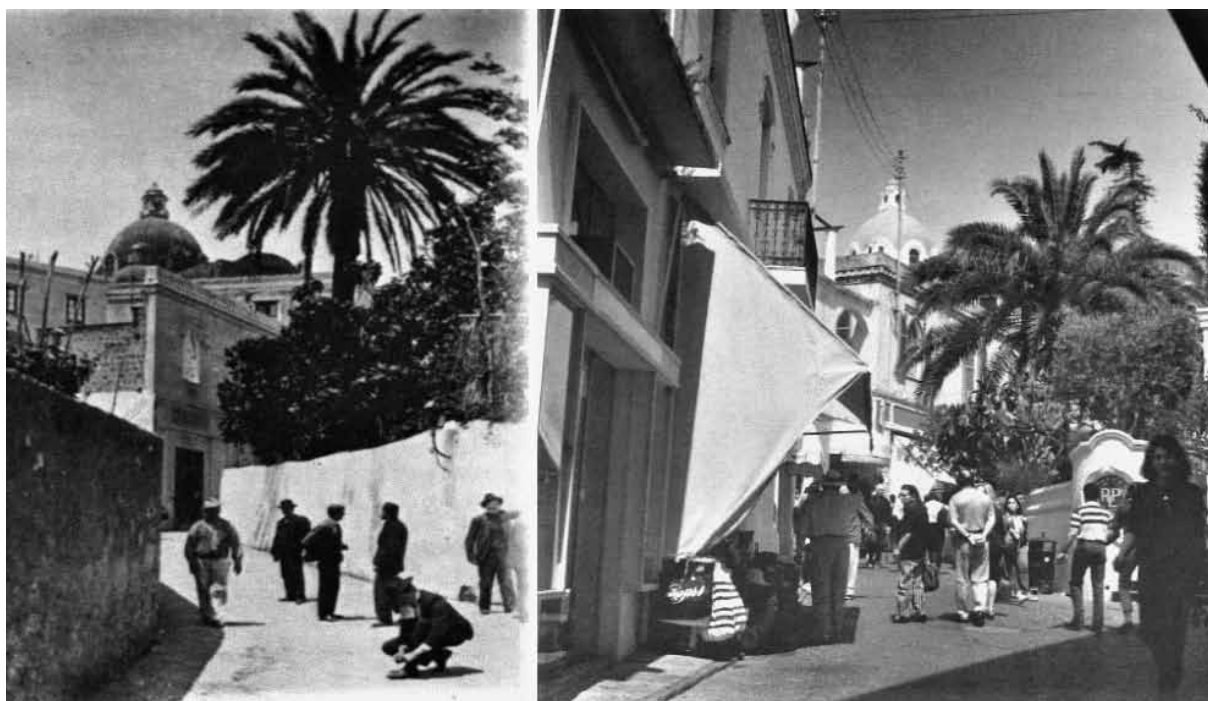
Fig. 5. Capri, Via Vittorio Emanuele e l'Hotel Pagano nel 1900 e oggi