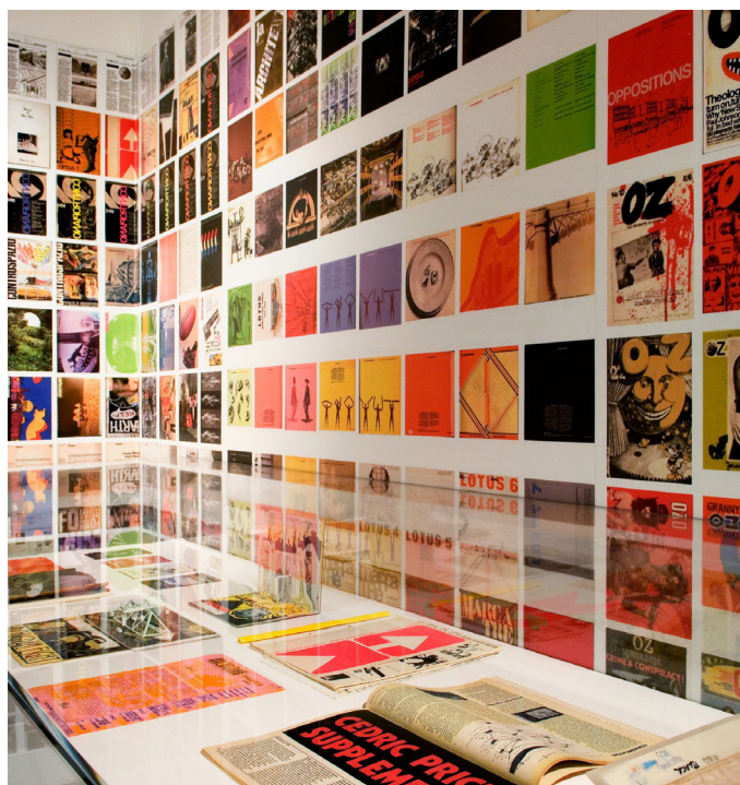
Immagine: Courtesy Clip/Stamp/Fold 2: The Radical Architecture of Little Magazines 196X - 197X. Installation view, 2007 Credit(s) © CCA

Periodo di apertura: 16/11 dalle ore 8.00 alle ore 20.00; 17/11 dalle ore 8.00 alle ore 17.00