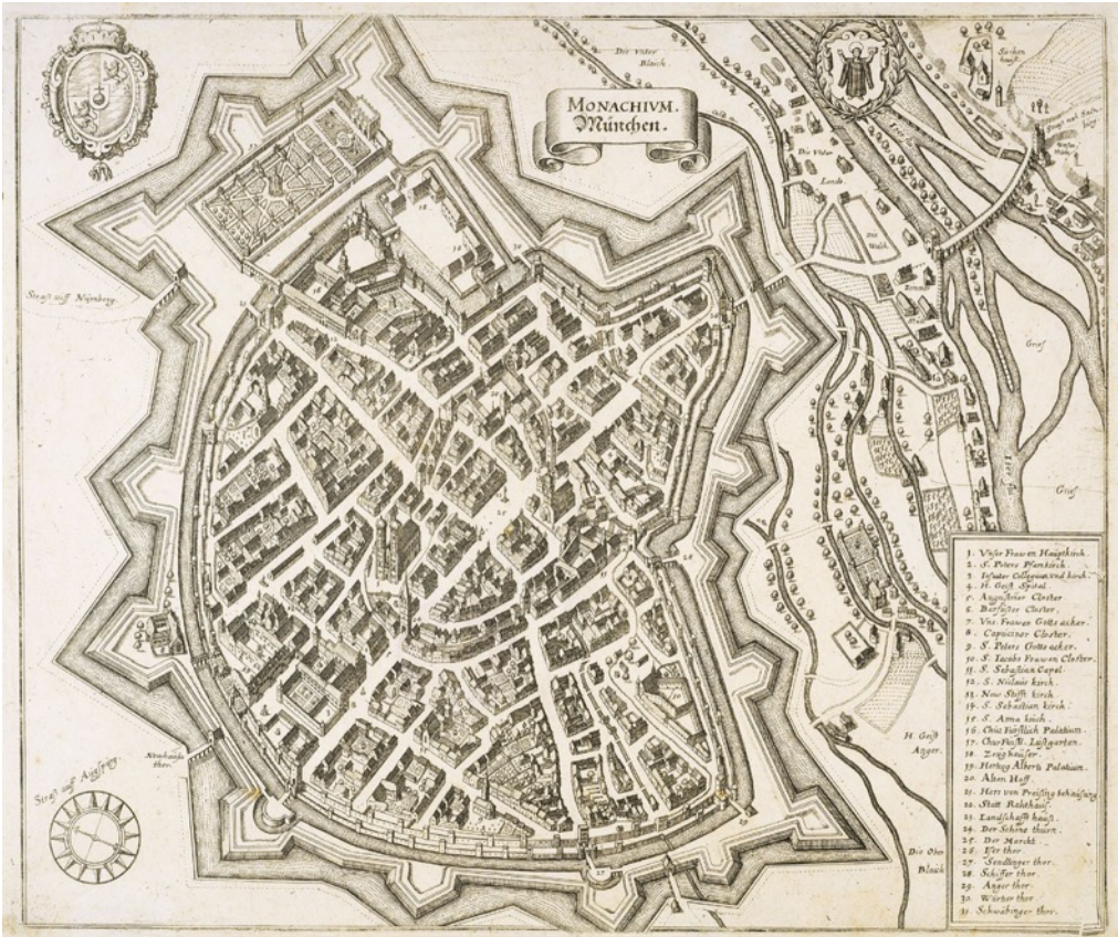
3: Matthäus Merian, Monachium München 1644. Bavariae München, da [Schiermeier 2006].

Qualche anno dopo, nel 1644, un importante incisore e editore di Basilea, Matthäus Merian [Iaccarino 2008], pubblicò un'altra veduta di Monaco nell'ambito di una più ampia serie di mappe delle città europee (Fig. 3). Rispetto alle vedute del 1613 e del 1623 in quella di Merian si può notare la costruzione della nuova cinta muraria, l'ampliamento della Münchner Residenz e la costruzione dell'Hofgartner.