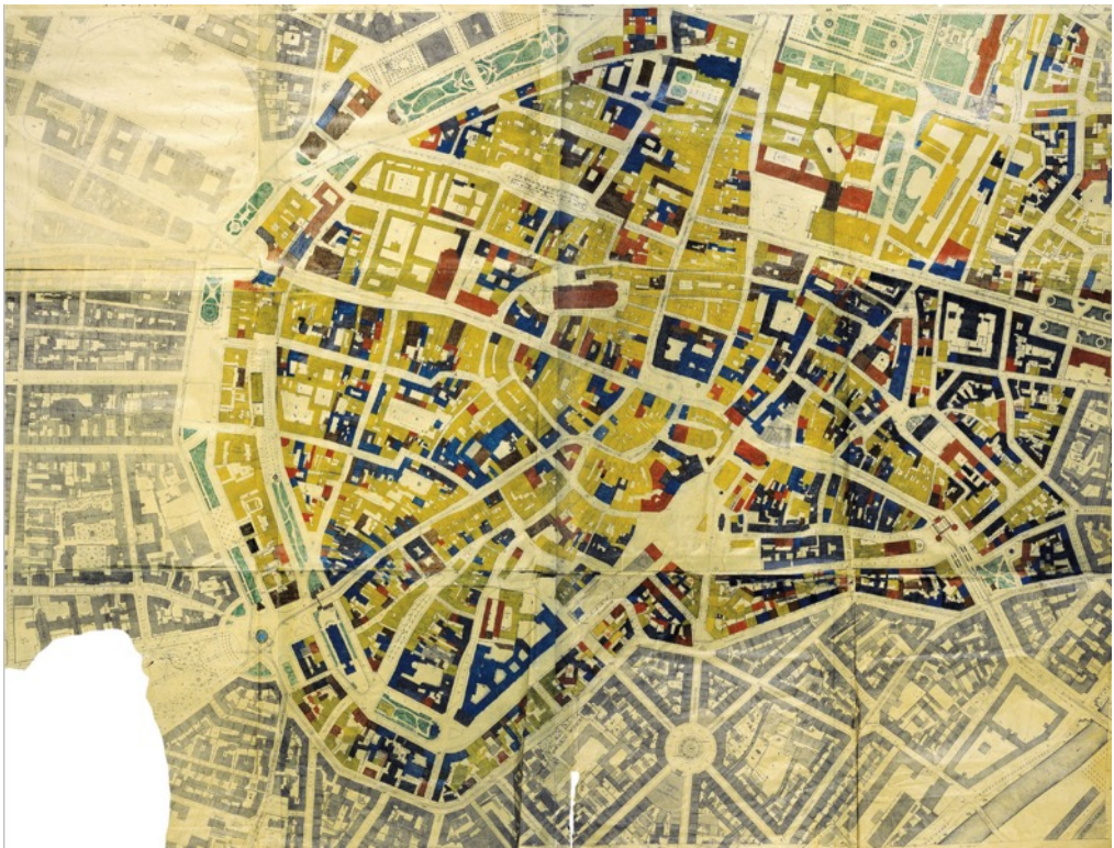
5: Schadenskarte der Münchner Innenstadt, 1945. Le perdite totali sono contrassegnate in giallo, rosso: danno grave, marrone: danno medio, blu: danno parziale. Solo gli edifici contrassegnati in nero non sono stati danneggiati o solo leggermente danneggiati.

Non è questa la sede per analizzare le modalità con le quali fu affrontato il tema della ricostruzione in Germania e, in particolare a Monaco [Rosenfeld 2000] – si rimanda al riguardo volume di M. Enss Münchens geplante Altstadt [Enss 2016] – va, comunque, sottolineato che la disponibilità di accurate planimetrie e di studi pregressi, hanno rappresentato un patrimonio di conoscenze indispensabile per le scelte che furono compiute. In particolare, il piano di Karl Meitinger [Meitinger 1946] per la ricostruzione della città fu elaborato proprio grazie alla disponibilità di cartografie urbane molto accurate ed aggiornate e al lavoro pregresso delle istituzioni cittadine responsabili della programmazione urbanistica, di cui Meitinger era parte.